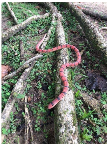
Figura 2 – Serpente Utilizada na Disciplina para Animar as Discussões sobre Vida