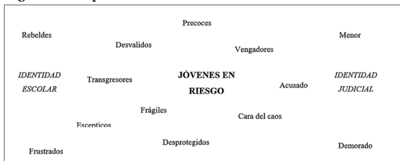
Diagrama 1 – Tipificación de las Juventudes en el Discurso Mediático