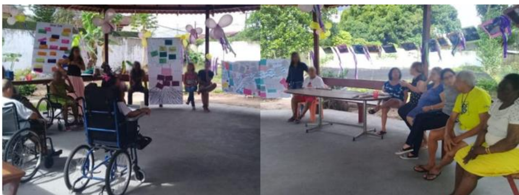
Figura 5. Cartografía, árbol de problemas, y fotografías.