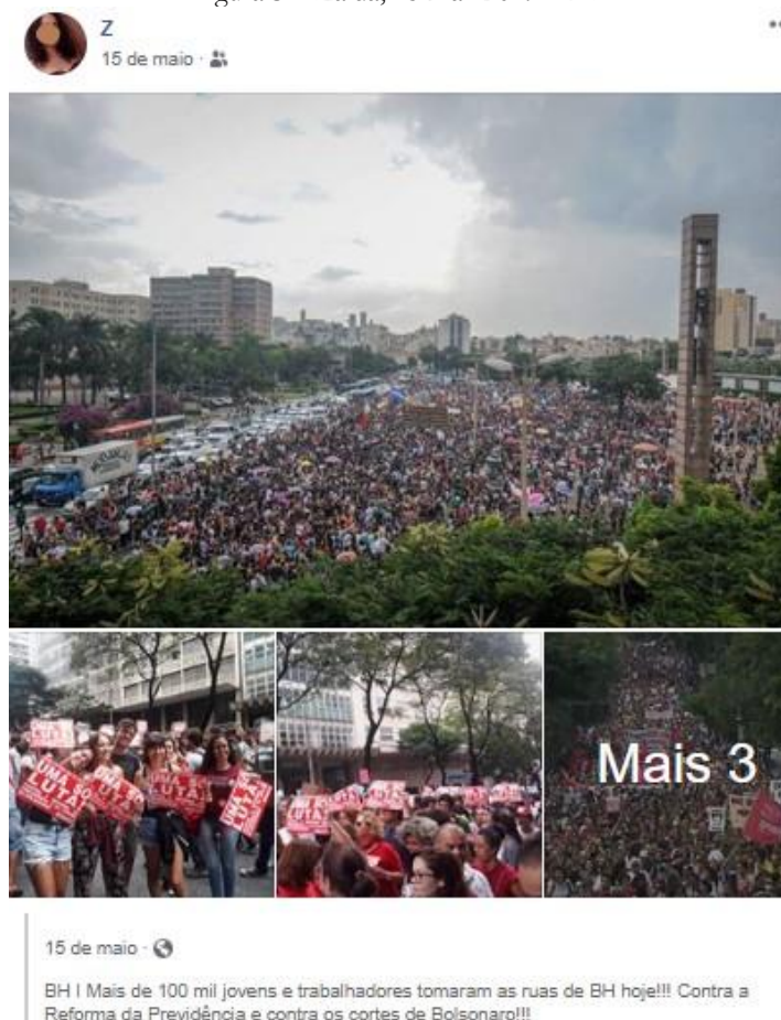
Figura 3 – Zaida, 15 mai. 2019 – BH

Fonte: Rede social Facebook Zaida, 15 mai. 2019.