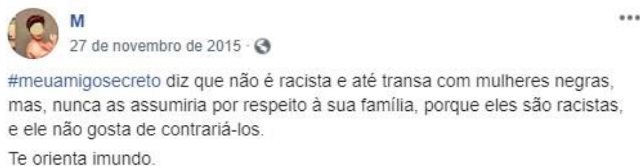
Figura 2 – Campanha #meuamigo secreto