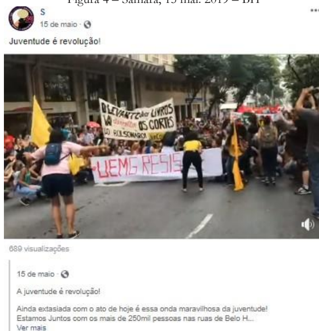
Figura 4 – Samara, 15 mai. 2019 – BH