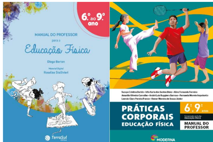
Figura 3 - Manuais do professor de Educação Física no PNLD 2020 - Anos Finais