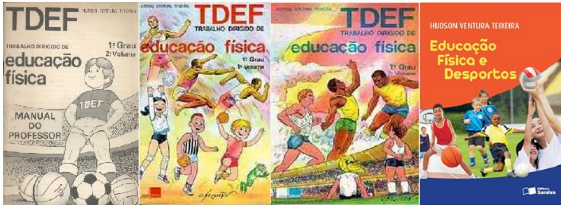
Figura 1 – O TDEF para o professor e para os estudantes