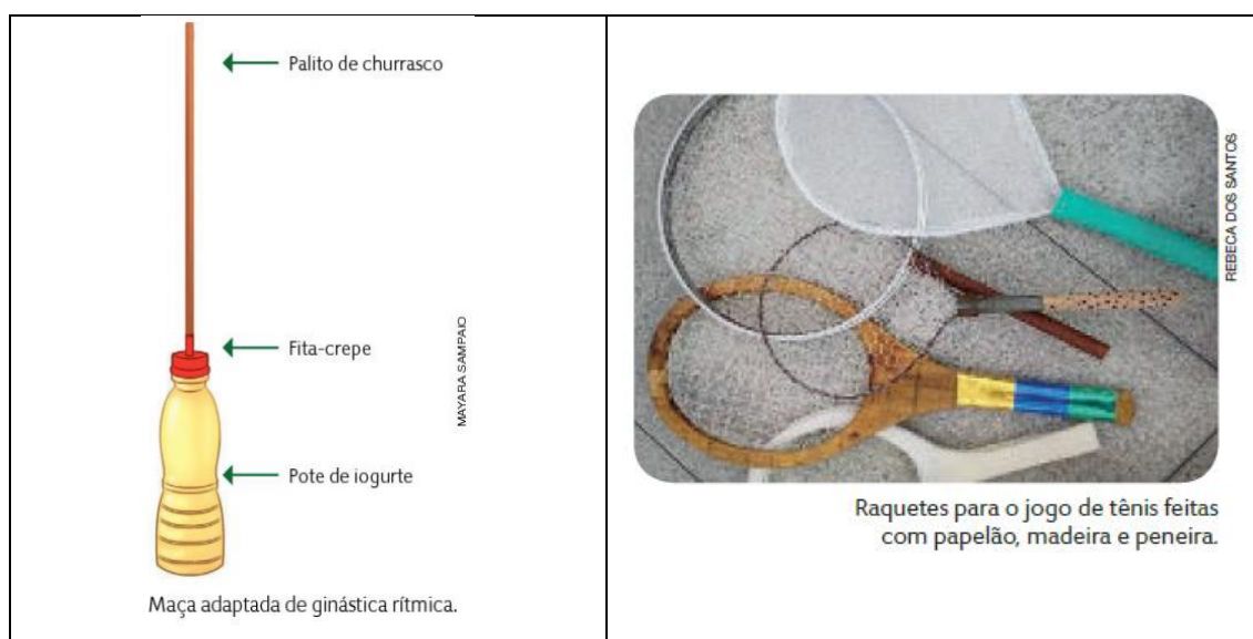
Figura 7 - Utilização de materiais alternativos para as aulas de EFE nos manuais

do ensino da Educação Física ainda tem o agravante de passar a mensagem de que “tudo pode ser ensinado” independente das condições de trabalho, basta se dedicar, seguir o roteiro e dominar o protocolo técnico do fazer docente.