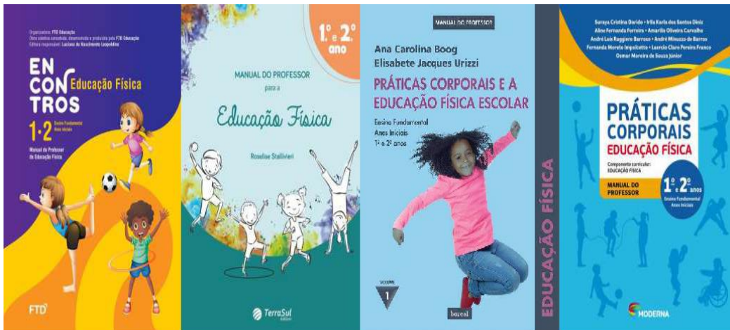
Figura 2 - Manuais do professor de Educação Física no PNLD 2019 - Anos Iniciais