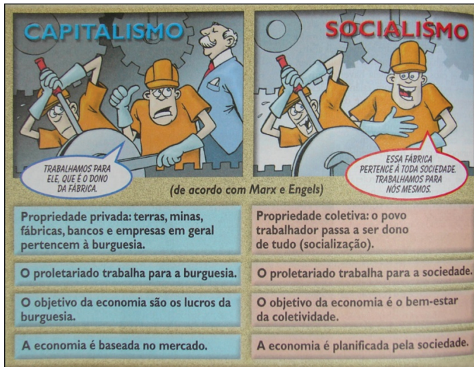
Figura 4 Uso de charges no livro didático Nova História Crítica – doutrinas sociais . São Paulo: Nova Geração, 2002.

A charge propõe o que ele chama de “doutrinas sociais”: o capitalismo e o socialismo. Ambos sob a imagem do que seriam o marxismo e engelsismo. De um lado, dois operários trabalhando, tendo ao fundo um patrão. Os dois estão vestidos com macacões e capacetes de cor laranja e o patrão com terno cinza, sóbrio, e gravata vermelha, investido de poder. O rosto dos operários expressa opressão e medo, e um diz: “trabalhamos para ele que é o dono da fábrica”. No quadro ao lado, os dois operários estão na mesma posição, com a mesma roupa, mas sem o patrão atrás e com a expressão de alegria e dizem a seguinte frase: “essa fábrica pertence a toda sociedade, trabalhamos para nós mesmos”. As expressões de opressão e de felicidade dos dois operários reforçam as afirmações em forma de perguntas apresentadas no texto A irracionalidade do capitalismo.