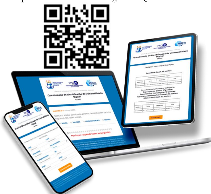
Figura 3: QR Code para ter acesso à versão digital do Q-IVD 4 em diferentes dispositivos