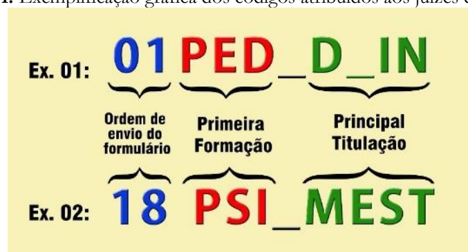
Figura 1: Exemplificação gráfica dos códigos atribuídos aos juízes do Q-IVD

Quanto à faixa etária, a idade média dos juízes correspondeu a 35 (trinta e cinco) anos, com variação mínima de 24 (vinte e quatro) e máxima de 47 (quarenta e sete), e desvio padrão de 6,5 anos. O gênero predominante foi o feminino, com 65% (17), e, no geral, 54% (14) dos participantes referiram ter mais de 10 anos de formação. Para preservar o anonimato dos participantes e facilitar a organização dos dados apresentados na Tabela 1, foi necessário estabelecer códigos para cada especialista, sendo que os dois primeiros caracteres numéricos se referem à ordem cronológica em que o participante enviou suas considerações acerca do instrumento avaliado; os três caracteres seguintes correspondem à inicial da primeira graduação informada no formulário sociodemográfico; em sequência, os últimos caracteres são referentes à titulação, como, por exemplo, ESP para se referir a Especialista, MEST para Mestre(a) e DR para Doutor(a), assim como M_IN e D_IN, Mestrando(a) e Doutorando(a), respectivamente, nas situações em que o curso de pós-graduação Stricto Sensu estava em fase de conclusão. Para facilitar a compreensão desses códigos, apresentamos duas exemplificações gráficas na Figura 1, a seguir.