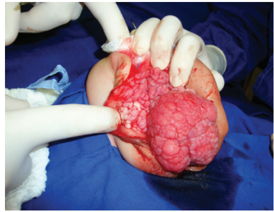
Figura 3. Massa com aspecto lobulado após incisão de linha média perineal

perineal revelou hamartoma composto de tecido conjuntivo fibroso com proliferação de capilares e vasos sanguíneos, conjunto de nervos, fibroblastos, epitélio, músculos lisos e formações ductais irregulares, coberto por urotélio. Não foram observadas complicações cirúrgicas. Após 16 meses de acompanhamento, o estado geral da criança era bom. As funções neurológicas dos membros inferiores estavam normais. O paciente tinha incontinência urinária contínua, sendo que a reconstrução do intestino deve ser realizada futuramente.