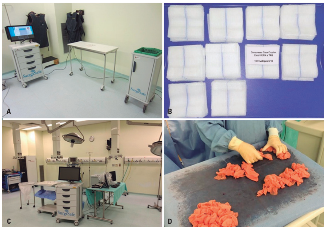
Figura 1. Aparato do SurgiSafe ® . (A) imagem do SurgiSafe ® , (B) compressas de gazes com TAGs, (C) sala cirúrgica e (D) contagem manual dos têxteis

O SurgiSafe ® , aparato devidamente registrado (Figura 1) e aprovado pela Agência Nacional de Vigilância