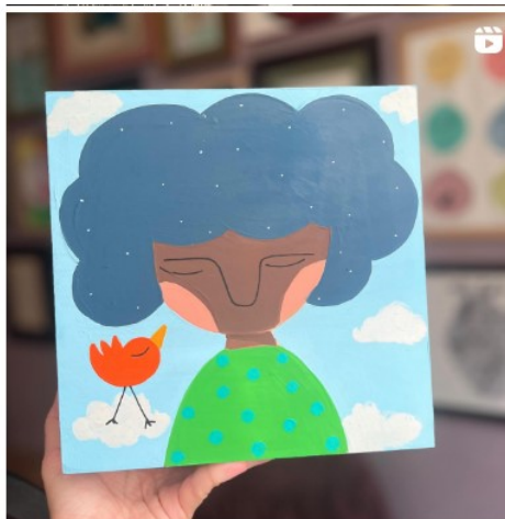
Figura 3 - Exemplo de dispositivo e procedimentos de leituras adotados por Manu Tasca com o Luca expostos no Instagram

Refletir e entender os sentimentos é um ato complexo que demanda uma leitura de si e um processo dialógico com o outro, que pode estar fisicamente ou por meio de um dispositivo informacional interferindo no ato de se (re)conhecer no mundo, a Mãe do Luca produziu um dispositivo, ilustrado na Figura 3, que o apoia nessa trajetória complexa que é conhecer a si e os sentimentos que são gerados a partir da sua relação com o outro.