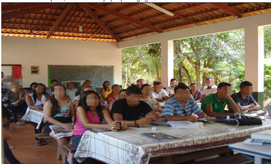
Figura 4 – Reunião com pais, alunos e equipe pedagógica na EFAZD