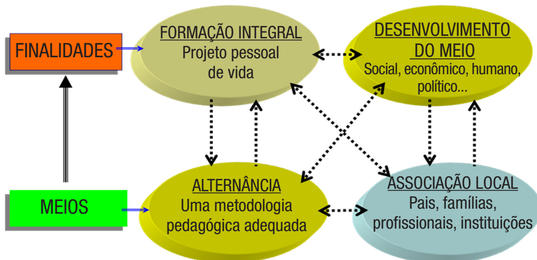
Figura 1 – Os quatro pilares dos CEFFA