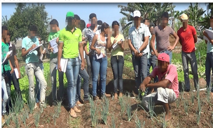
Figura 3 – Visita de estudo – PE olericultura*

* Esta imagem registra outra visita de estudo dos alternantes a uma horta para ampliar os conhecimentos sobre o tema do PE olericultura.