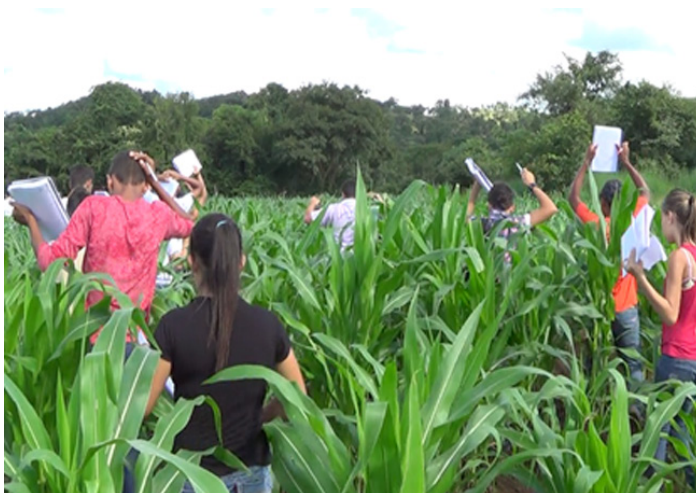
Figura 2 – Visita de estudo – PE agricultura familiar*

* A foto retrata a visita de estudo relacionada à agenda de atividades de estudo do tema do PE agricultura familiar, previsto no plano de formação (Anexo 1).