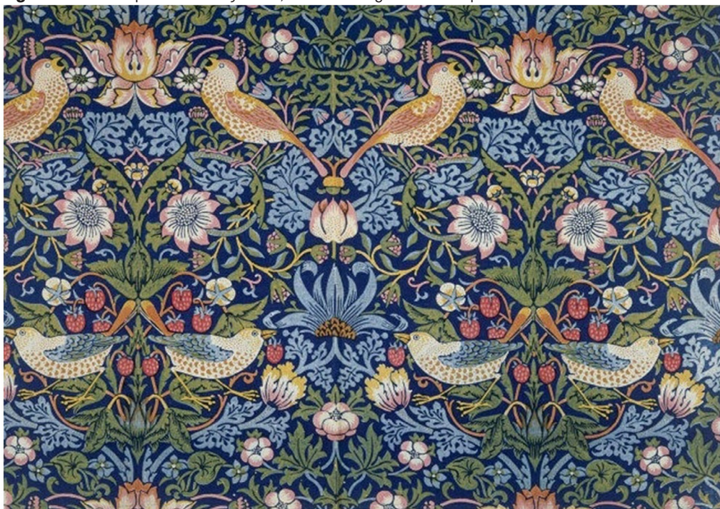
Figura 4 – Estampa Strawberry Thief , tecido de algodão estampado com carimbo

A quarta estampa é de William Morris, chamada Strawberry Thief (Ladrão de Morango), de 1883 (Figura 4). Essa estampa, em tecido para decoração, é uma das mais conhecidas desse artista, designer , teórico e ativista. Os pássaros são tordos de caudas longas e curtas e foram desenhados por Philip Webb. O tecido de algodão também apresenta folhas de acanto azuis e morangos vermelhos. Começaram a ser desenhadas, a princípio, como arabescos e ornamento na arquitetura clássica. Durante o Renascimento foram popularizadas. Representa rituais fúnebres e é associada à vida longa. Os elementos estão contra um fundo azul-escuro com um cenário típico do movimento arts & crafts, movimento estético do final do século XIX (EDWARDS, 2012).