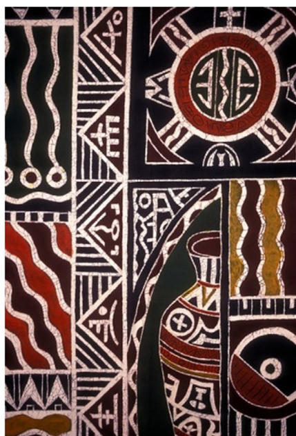
Figura 1 – Estampa batik

A primeira estampa do questionário é um tecido africano estampado com a técnica de batik , do Zimbábue, sem autor conhecido e registrada pelo fotógrafo Robert Fried (Figura 1).