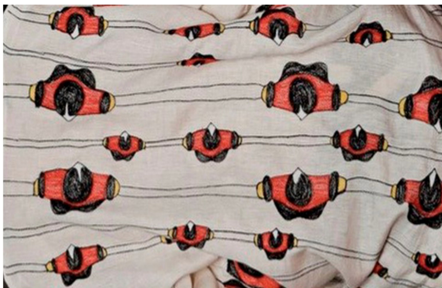
Figura 3 – Estampa de Ronaldo Fraga da coleção F.U.T.E.B.O.L

A terceira estampa é do estilista Ronaldo Fraga, da coleção F.U.T.E.B.O.L, apresentada no desfile de verão 2014 do São Paulo Fashion Week (Figura 3).