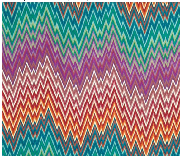
Figura 2 – Estampa Narboneta, coleção Girandole da Missoni Home

ficou conhecida pelos tecidos com zigue-zague, inspirados na arte óptica e em desenhos tribais africanos. A princípio, os desenhos eram padronagens têxteis feitas na malharia do tricô; posteriormente, os fundadores Rosita e Ottavio Missoni utilizaram também a estamparia para projetar os zigue-zagues de cores e formatos variados.