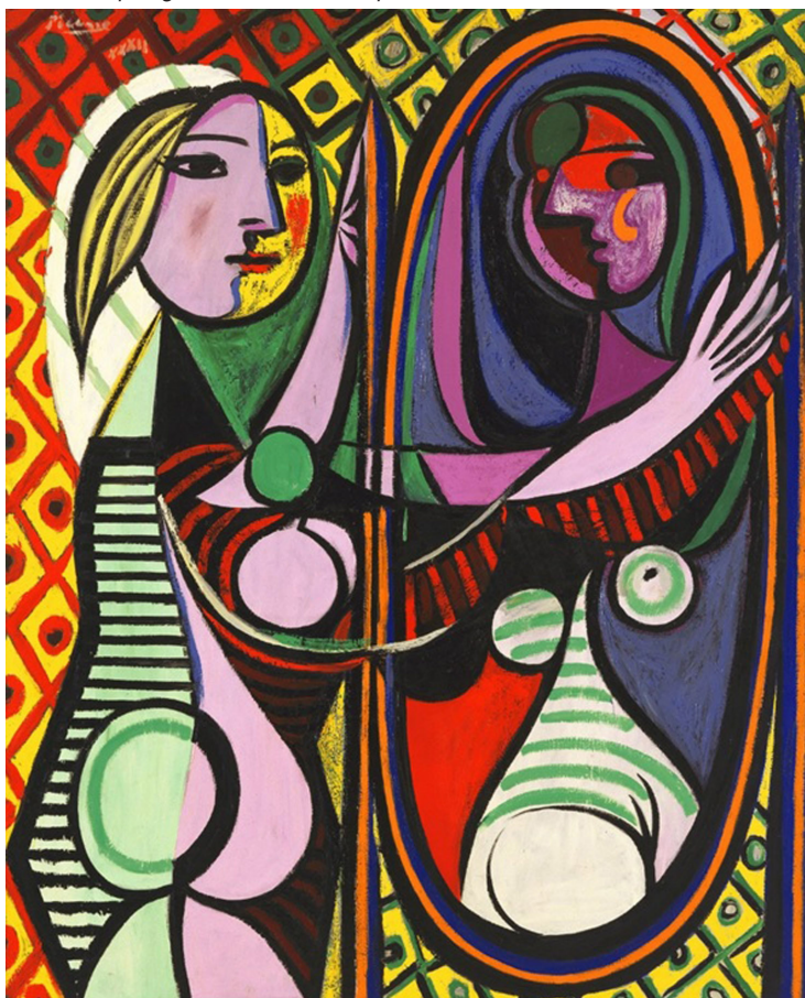
Figura 6 – Rapariga em frente do espelho , óleo sobre tela