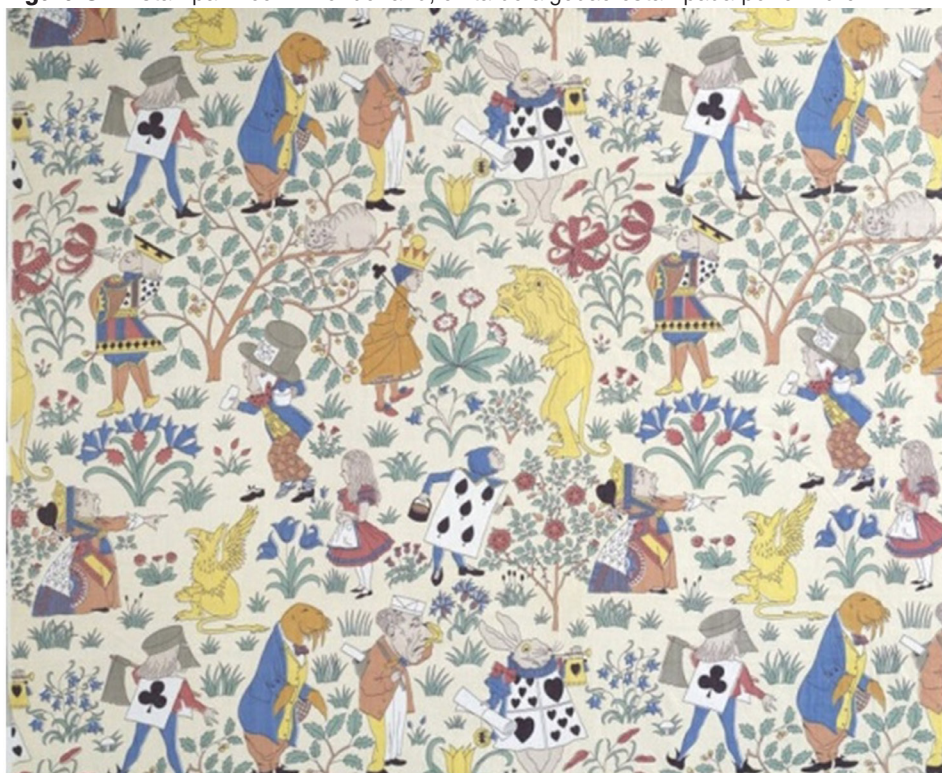
Figura 5 – Estampa Alice in Wonderland, chita de algodão estampada por cilindro