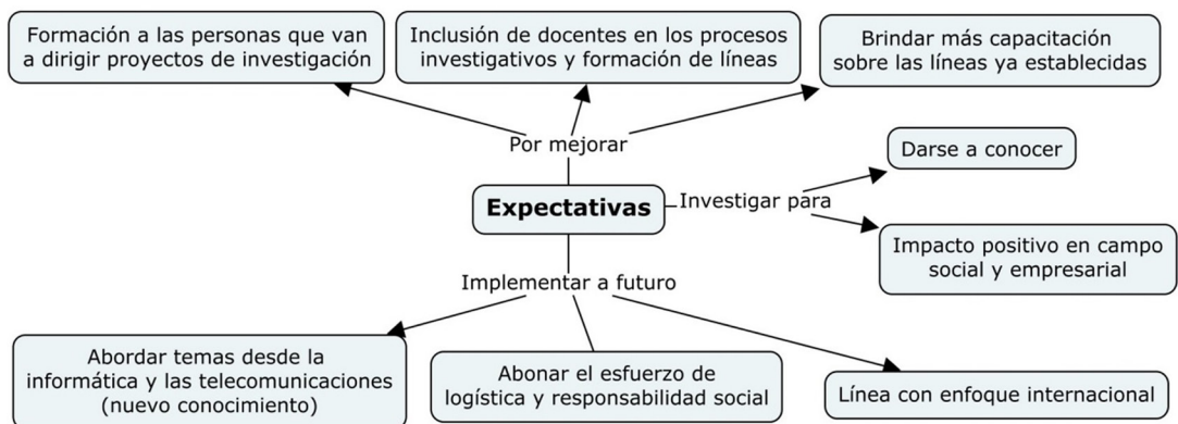
Mapa 4- Expectativas de los procesos investigativos

Fuente: Elaboración propia a partir de aplicación del instrumento.