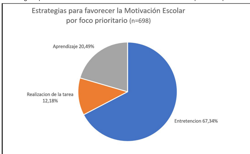
Figura 1: Estrategias para favorecer la motivación escolar: distribución por foco prioritario (en %).