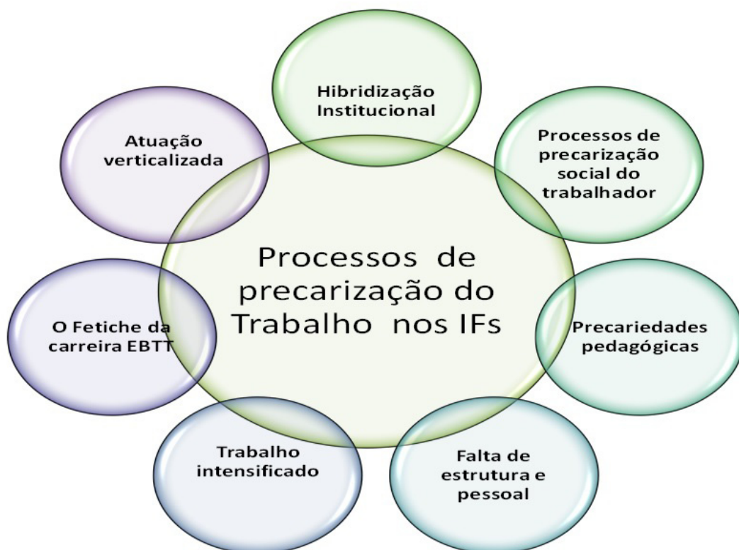
Figura 2 – Processos de precarização do trabalho docente nos IFs

Como sintetizamos na figura 2, diversos processos constroem a precariedade da atuação docente nos IF: