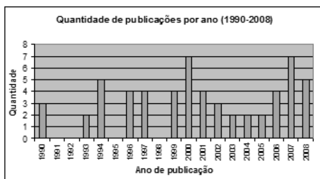
Figura 2: Gráfico da quantidade de publicações relacionadas à Astronomia, de 1990 até 2008

Inferências: nota-se claramente que o número de publicações foi maior na segunda década analisada. Além disso, a ocorrência de publicações tornou-se anual a partir de 1999, o que pode indicar consolidação da área de pesquisa relacionada à Astronomia no país. Além disso, em 1998 foram publicados os Parâmetros Curriculares Nacionais para o terceiro e quarto ciclos do ensino fundamental (BRASIL, 1998), que apresentaram uma série de conteúdos relacionados à Astronomia, o que pode ter incentivado a pesquisa desses temas e ocasionado o acréscimo das publicações.