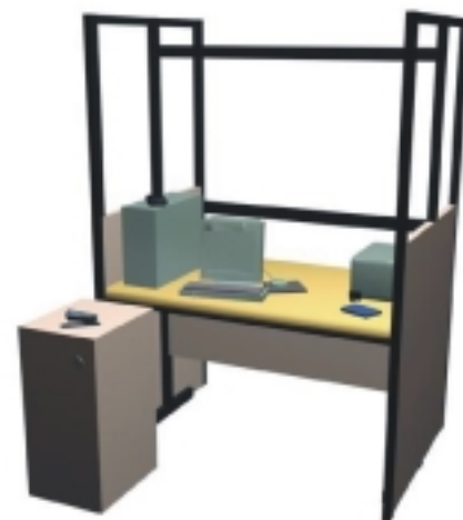
Figura 2. Posto de trabalho típico utilizado no atendimento ao público

(a) limites intrínsecos: em algumas telas, as funções de alterações, multas, consultas e impressões não estão agru-