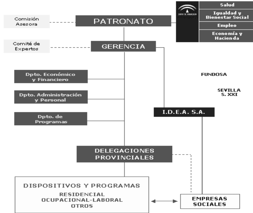
Figura 1. Organigrama de FAISEM

sino también de otras profesiones polivalentes que ofrecieran apoyo y soporte afectivo, social, laboral, etc, y, además de nuevas redes, sin exclusión de las generales ni de las específicas; de otro, el recelo a perder la hegemonía de la asistencia psiquiátrica tradicional. Sea como fuere, la implantación de FAISEM al final de la década fue un hecho irreversible, cuyas aportaciones cuantitativas no admiten discusión como puede verse en la siguiente tabla de evolución de los recursos sociales para los pacientes con trastorno mental grave (Tabla 1):