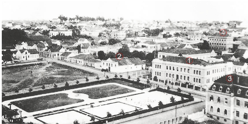
FIGURA 3 - VISTA DA PRAÇA BARÃO DO RIO BRANCO

A imagem abaixo apresenta uma vista parcial da Praça Barão do Rio Branco, antigo Largo do Rosário, com a localização da Escola Normal de Ponta Grossa (número 1). Dentre as construções do entorno da praça, estavam a Igreja Nossa Senhora do Rosário (nº 2) e o prédio do Colégio Sant’Ana 12 (nº 3), construído em 1910. Essa escola foi a primeira instituição de ensino feminino de confissão católica do município. Segundo Gisele Q. L. Chornobai (2002), o prédio do Colégio Sant’Ana, construído em três andares, era bastante visível, tanto pela sua localização quanto pela sua arquitetura imponente. Os símbolos cristãos em destaque na fachada, a cruz e uma imagem de Sant’Anna, traduzem a intenção de mostrar que aquele edifício representava a igreja católica (CHORNOBAI, 2002, p. 102).