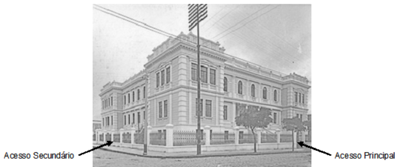
FIGURA 2 - PALÁCIO DA INSTRUÇÃO ESCOLA NORMAL, DATA 22 DE SETEMBRO DE 1922

Assim, o posicionamento do edifício, localizado em terreno de esquina, valorizava esteticamente a obra, dando maior visibilidade à sua monumentalidade. Regras defendidas pelas teorias higienistas da época, como orientação, ventilação, terrenos altos e, sobretudo, a distância das construções vizinhas, também foram respeitadas. A imagem abaixo foi fotografada no dia da inauguração e tem como destaque principal o “suntuoso prédio” esperado pela população. Finalmente estava construída a primeira escola Normal do Paraná, que seria por mais de três anos o único espaço público dedicado à formação dos professores normalistas do Estado.