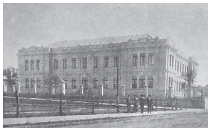
Escola Normal de Ponta Grossa