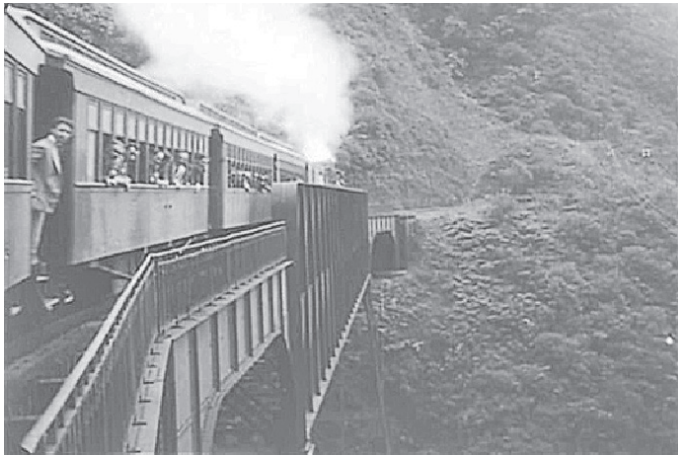
FIGURA 1 - TREM SOBRE A PONTE PARANAGUÁ-CURITIBA

Nesse percurso de trem, o documentário ressalta a monumentalidade da obra, cujo ápice é a ponte que se destaca na Mata Atlântica. A imagem contrasta a beleza natural com a arrojada tecnologia da obra de engenharia. As cenas sugerem uma harmonia entre natureza e tecnologia. Os passageiros aparecem satisfeitos com o que veem e o cinegrafista não deixou de registrar a imagem dos curiosos que acenam para sua câmera, conforme representação da imagem abaixo.