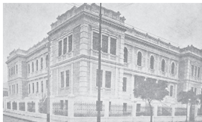
Escola Normal de Curitiba