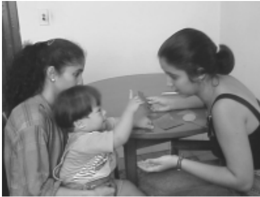
ILUSTRACIÓN 2 - PSICÓLOGA HACIENDO UN DIAGNÓSTICO

A su vez, la Psicología Especial tiene ramas, las cuales responden, siguiendo a VYGOTSKY, a la estructura del defecto presente y sus consecuencias, que resultan diferentes en cada una de las categorías de discapacitados, lo que lleva a que los problemas psicológicos fundamentales, el abordaje del área, la intervención, etc., sean peculiares y diferentes entre sí. Por ello cada rama de la Psicología Especial presenta su objeto específico.