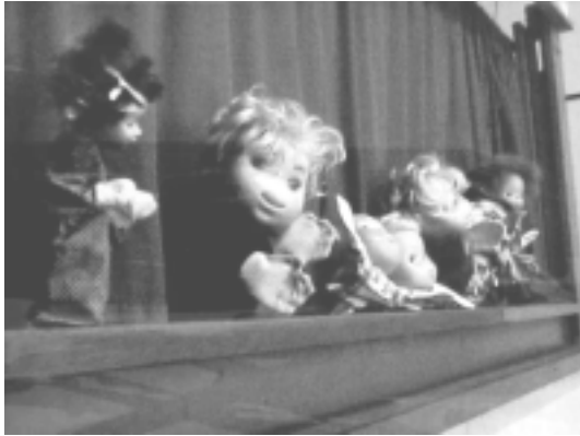
ILUSTRACIÓN 3 - PSICOTÍTERES - ACTIVIDAD TERAPÉUTICA