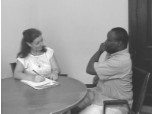
ILUSTRACIÓN 1 - ENTREVISTA A UN SÍNDROME DOWN

Se puede afirmar que la Psicología Especial tiene por objeto de estudio las particularidades psicológicas de las personas que presentan desviaciones en su desarrollo y pueden estar determinadas por diferentes causas tales como: