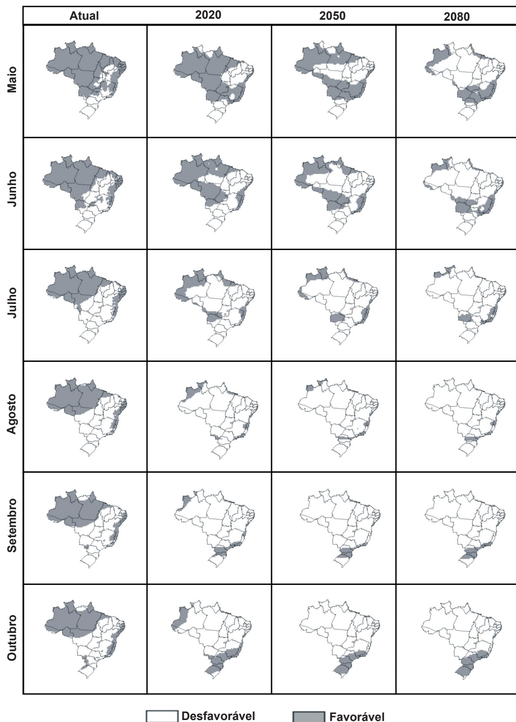
FIG. 4 - Mapa de favorabilidade climática à sigatoka-negra da bananeira no Brasil, para os meses de maio a outubro, no período atual (média de 1961 a 1990) e futuro (2020, 2050 e 2080, para o cenário B2).

Apesar de ocorrer redução, nota-se que extensas áreas do país ainda continuarão com condições favoráveis à doença, o que deve implicar na necessidade de adoção de medidas de controle, especialmente no período de novembro a abril (Figuras 1 e 3). Nos meses de menor favorabilidade,