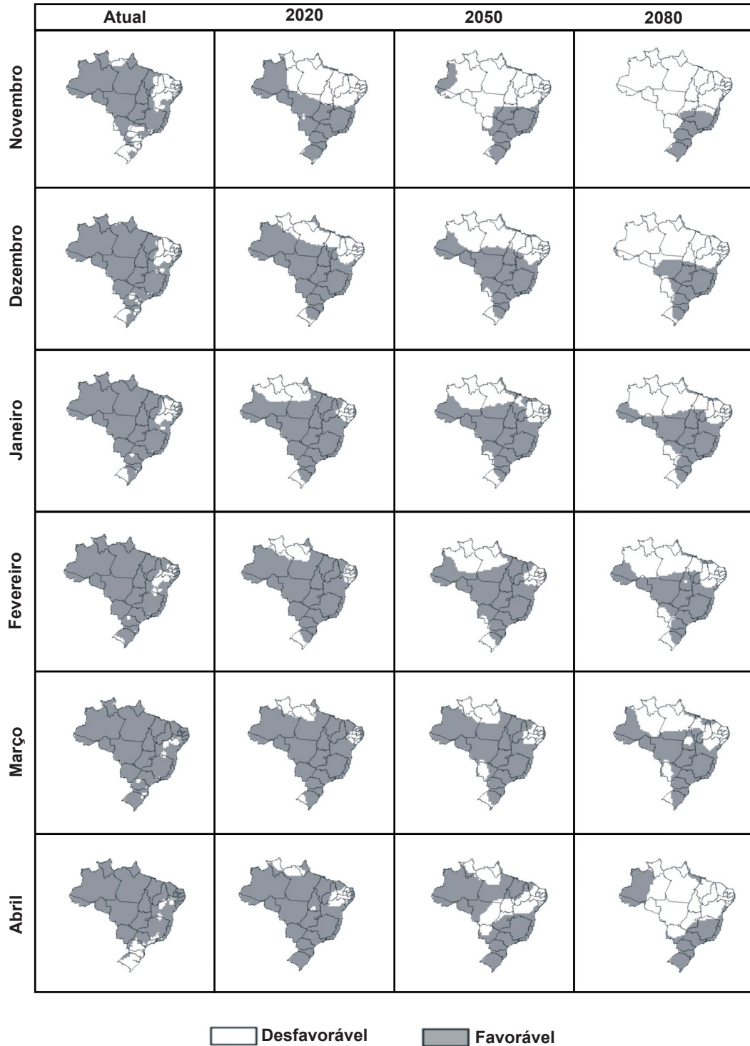
FIG. 1 - Mapa de favorabilidade climática à sigatoka-negra da bananeira no Brasil, para os meses de novembro a abril, no período atual (média de 1961 a 1990) e futuro (2020, 2050 e 2080, para o cenário A2).

indicam que, de um modo geral, haverá redução da área favorável ao desenvolvimento da doença no país, em relação ao clima atual, tanto para o cenário A2 (Figuras 1 e 2) quanto para o B2 (Figuras 3 e 4). Tal redução está projetada tanto para o período de maior favorabilidade à doença (meses