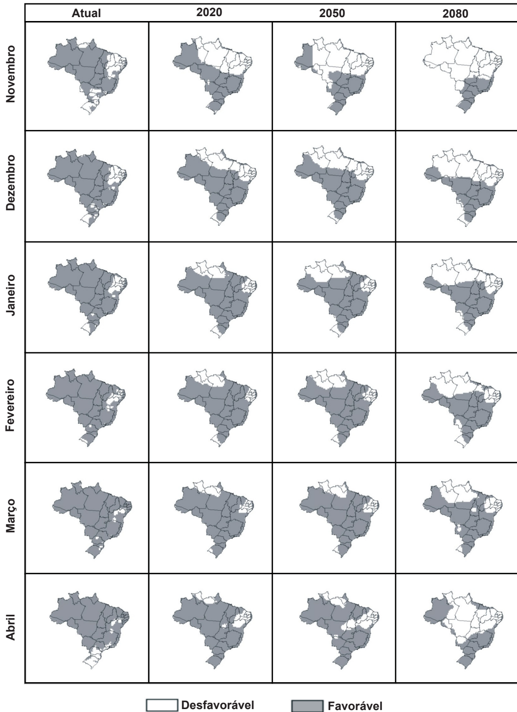
FIG. 3 - Mapa de favorabilidade climática à sigatoka-negra da bananeira no Brasil, para os meses de novembro a abril, no período atual (média de 1961 a 1990) e futuro (2020, 2050 e 2080, para o cenário B2).

cenário B2, resultando em condições menos favoráveis à sigatoka. Além disso, a redução da área favorável à doença é gradativa nas três décadas estudadas para os dois cenários, isto é, a cada década, a área favorável sofre reduções. Por exemplo, no período considerado atual, para os meses de