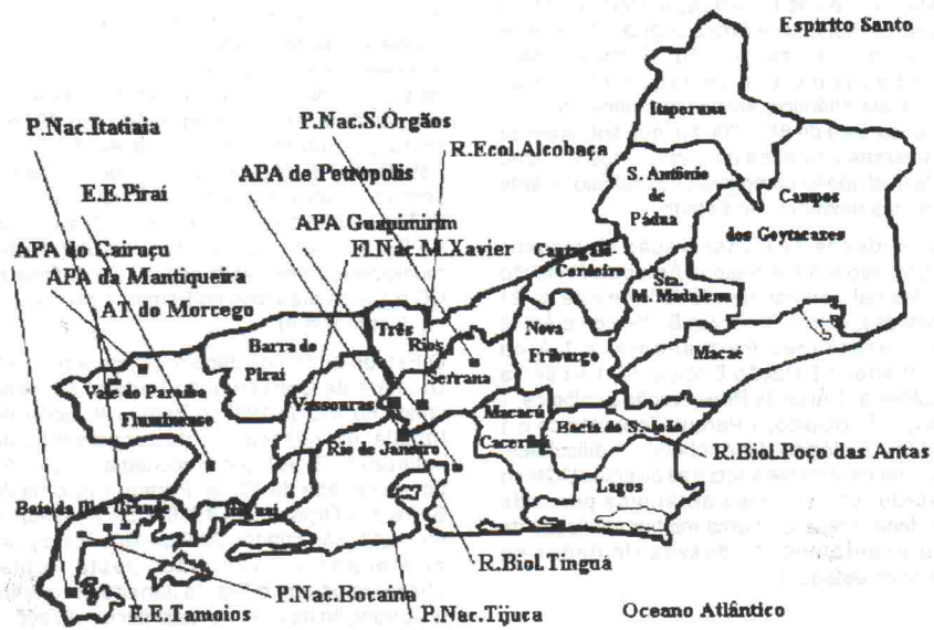
FIGURA 1 - Localização das Unidades de Conservação Federais.