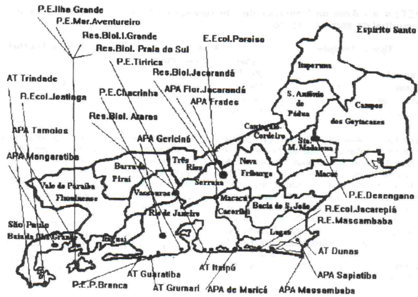
FIGURA 2 - Localização das Unidades de Conservação Estaduais