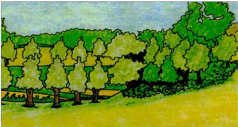
Figura 7: Expectativa futura da revegetação do Aterro Sanitário.