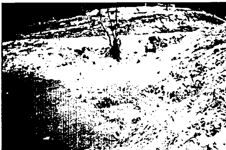
Figura 2: Vista parcial da Lagoa, com deslizamento no entorno.