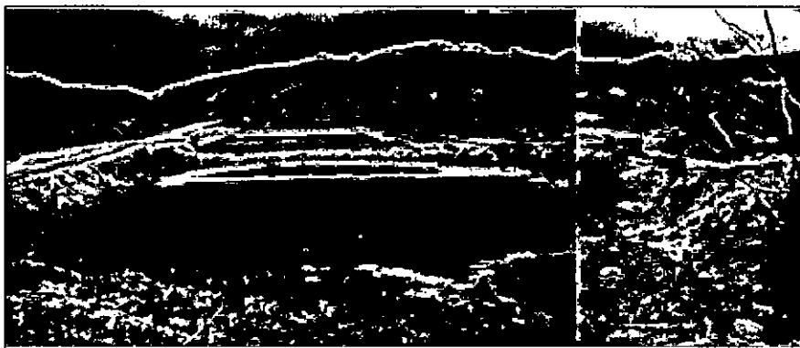
Figura 1: Vista geral do entorno dos lagos, situação atual.

O aterro sanitário municipal, localizado na estrada do Caxito - Caxito grande s/nº, no município de Maricá terá a área total arborizada de 8700 m 2 , área de gramados de 4500 m 2 , utilizando o total de 600 mudas de espécies arbóreas dos distintos grupos ecológicos, que serão plantadas no entorno das lagoas, conforme demonstra as figuras. nº 01 e 02, e no entorno do aterro, demonstrado pelas figuras nº 03 e 04.