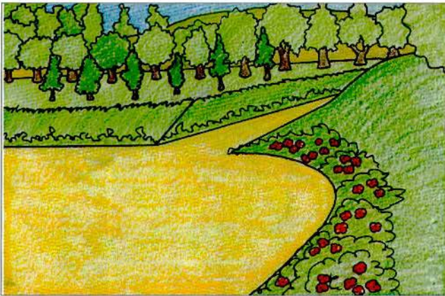
Figura 6: Expectativa futura da revegetação da área.