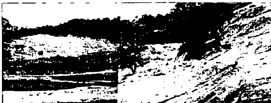
Figura 3: Vista parcial do Aterro Sanitária e Lagoa de Decantação.