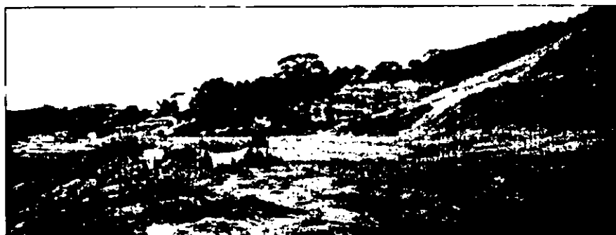
Figura 4: Vista lateral de acesso ao Aterro Sanitário