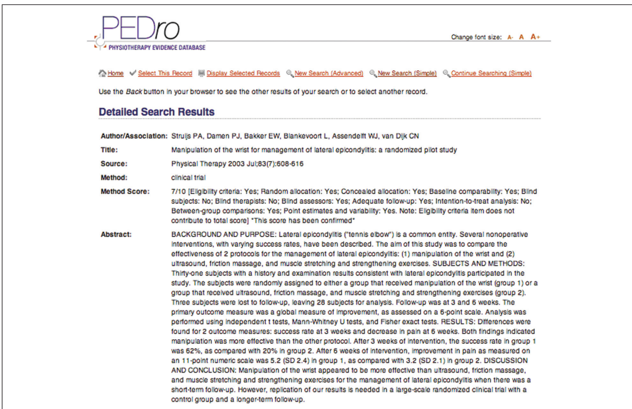
Figura 3 - Detalhes do resultado da busca