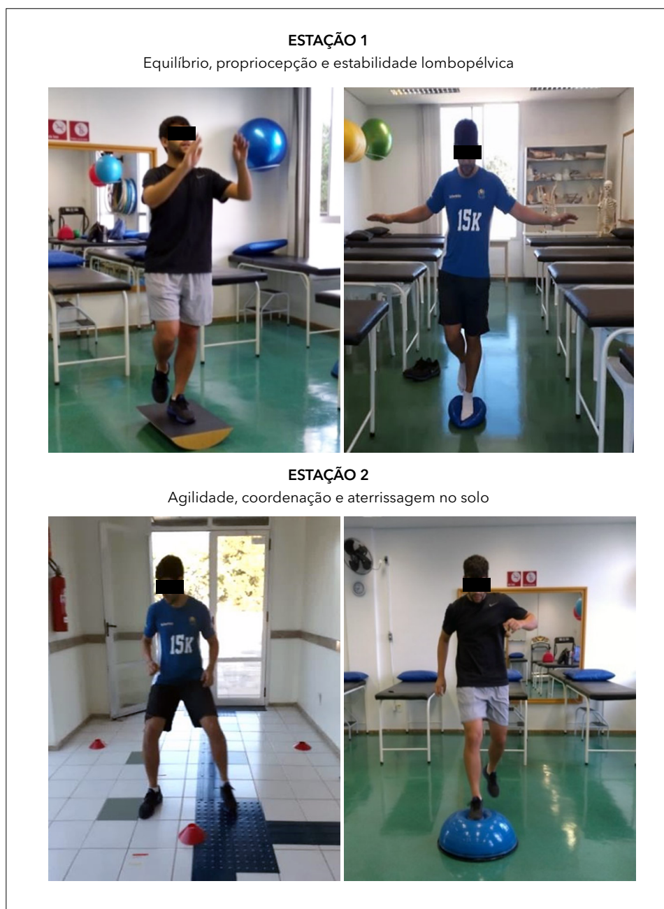
Figura 1 - Demonstração da execução do treinamento sensório-motor.

O protocolo de treinamento sensório-motor teve evolução progressiva do nível de dificuldade dos exercícios, a cada quatro intervenções (Tabela 1). Ao final das 16 intervenções, ambos os grupos foram submetidos à avaliação final (idêntica à inicial) para investigar e comparar os efeitos do treinamento.