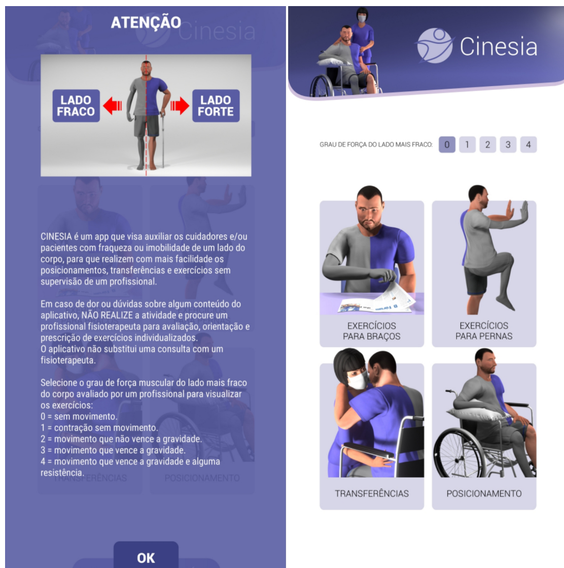
Figura 2 - Tela inicial do aplicativo móvel CINESIA.

A média final de IVC de todos os 23 itens após a segunda rodada do questionário foi de 0,85, atingindo a concordância mínima de 0,80 sugerida por autores (Tabela 1). 30 Devido ao resultado da segunda rodada dos questionários apresentar um IVC < 0,80 em quatro itens, inclusive em itens aprovados previamente, optou-se pela divisão de exercícios de acordo com o grau de comprometimento de força muscular do paciente. Sendo assim, foram desenvolvidos nove exercícios novos destinados aos pacientes com hemiplegia e hemiparesia graus 1 e 2 e realizada uma terceira rodada de questionários para avaliação dos novos conteúdos.