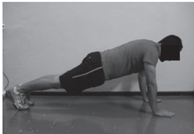
Figura 1 - Posição inicial