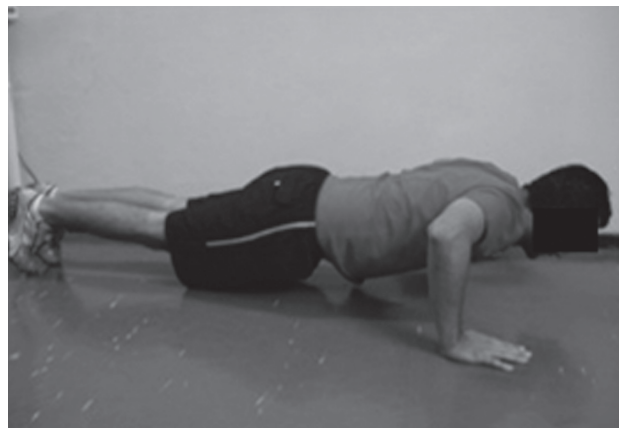
Figura 2 - Posição final

1, 2). A aplicação do teste para o sexo feminino é modificada apenas pelo apoio dos joelhos sobre o solo (18). Os demais procedimentos são realizados para ambos os sexos. É recomendado que o avaliado execute algumas vezes o movimento para melhor