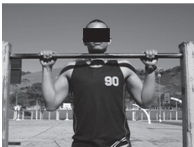
Figura 4 - Posição final

resultado, por conta da fadiga muscular (6). Para o sexo feminino, deve-se ter o cuidado de acionar o cronômetro assim que a avaliada assuma a posição em suspensão na barra e de travá-lo quando o