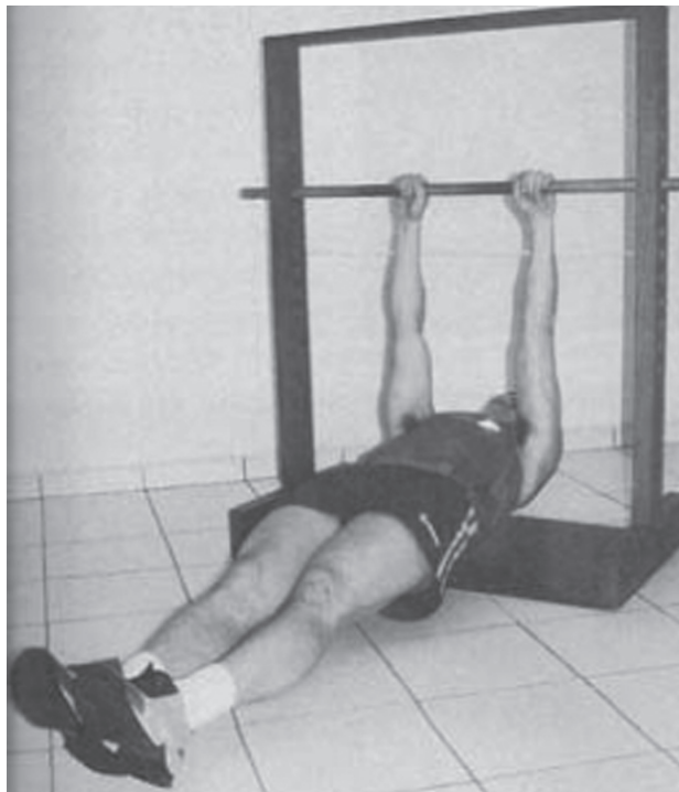
Figura 5 - Posição inicial