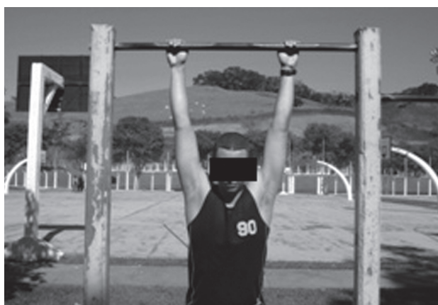
Figura 3 - Posição inicial