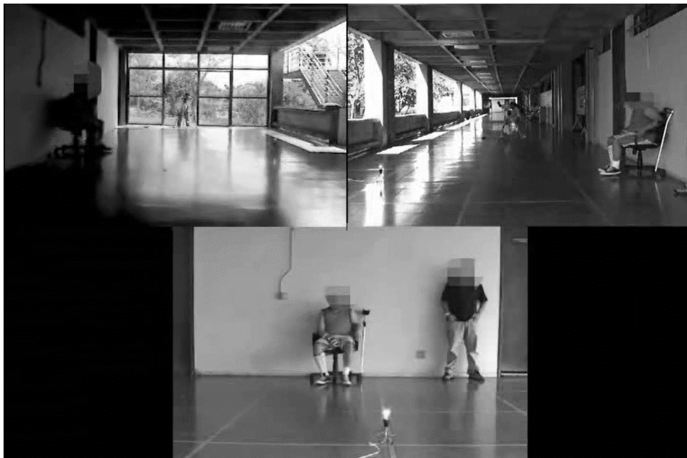
Figura 1. Realização do teste timed "up and go" assessment of biomechanical strategies (TUG-ABS)