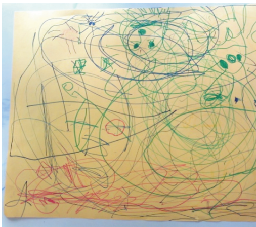
Figura 6: Registro do que há no meio do mar

Figuras 3, 4, 5 e 6: Desenhos coletivos das crianças.