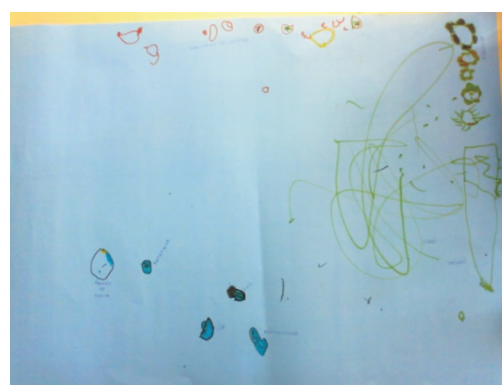
Figura 5: Registro do que há no meio do rio