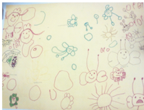
Figura 3: Registro do que há no meio do céu

Já no dia 25 de fevereiro de 2013, a professora fez referência à história contada nos dias anteriores, mas pontuou que o trabalho desse dia não seria como o dos outros. Dessa vez, ela propôs que as crianças trabalhassem em grupos de quatro crianças cada para registrarem com desenhos em uma folha de cartolina o que havia no meio do “mar”, do “céu”, do “rio”, e do “sol” (Figuras 3, 4, 5 e 6).