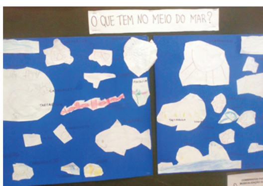
Figura 2: Mural “O que tem no meio do mar?”

No dia 20 de fevereiro de 2013, a professora recontou a história e propôs novamente que as crianças registrassem a narrativa em uma folha, solicitando que elas recortassem os desenhos e os colassem em um cartaz cujo título era “O que tem no meio do mar?” (Figura 2).