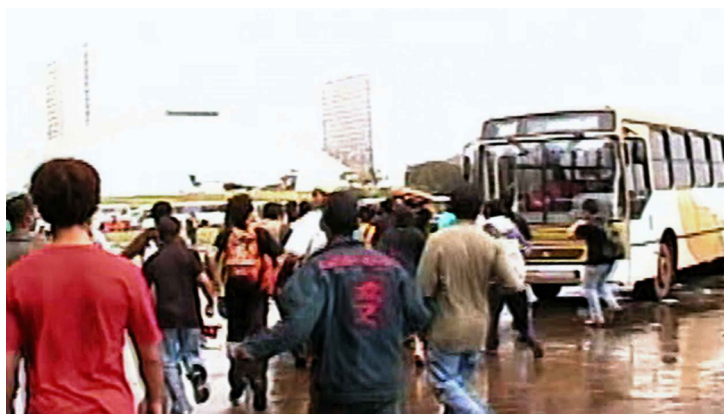
Fig.3. Imagem utilizada no filme do arquivo dos militantes da histórica mobilização contra o aumento da tarifa realizada em 2006 na rodoviária de Brasília.

do documentário a partir do qual se apresenta o outro lado de Brasília (o dos “excluídos” do Plano Piloto), em Ressurgentes a Rodoviária do DF constitui também um marco, mas dessa vez para indicar os desdobramentos das lutas e uma aglutinação de sujeitos. Esses sujeitos, mais tarde, reunidos em movimentos autônomos, irão questionar todo o histórico de problemas sociais vividos na cidade, reconectando as lutas aos problemas da origem da cidade. Bem, aqui não se trata mais apenas da retomada dos arquivos, mas do uso de uma imagem “símbolo”, a Rodoviária, que aporta em si mesma, a partir de sua incorporação, sentidos históricos para as lutas atuais.