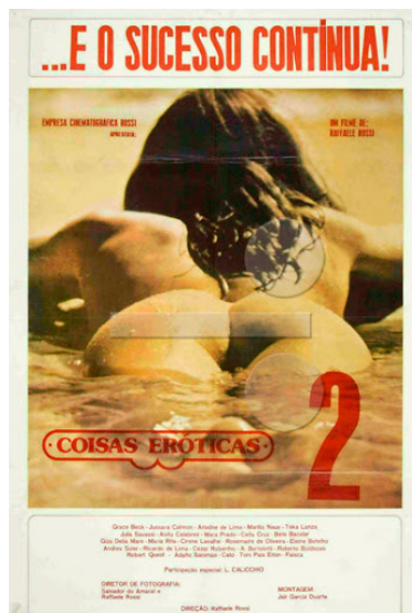
Figuras 4 e 5. Cartazes dos filmes Coisas Eróticas e Coisas Eróticas 2 .