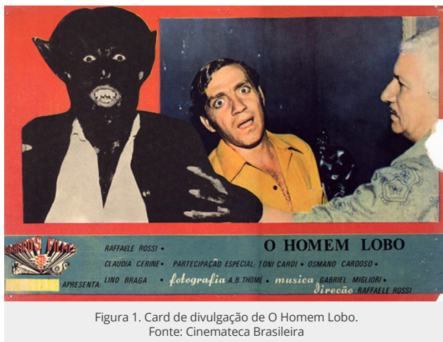
Figura 1. Card de divulgação de O Homem Lobo .

Foi como resultado de uma dessas trambicagens que Rossi realizou e estrelou seu primeiro longa-metragem de ficção, O Homem Lobo (Fig. 1), iniciado em 1966, mas lançado apenas em 1971. Como relata Sanches (2013, p. 14), em troca de hospedagem em um hospital em construção e de algum dinheiro para a realização do filme, Rossi deixou para os habitantes da cidade mineira de Alterosa (MG) seu primeiro documentário, intitulado A Cidade Sorriso (1966).