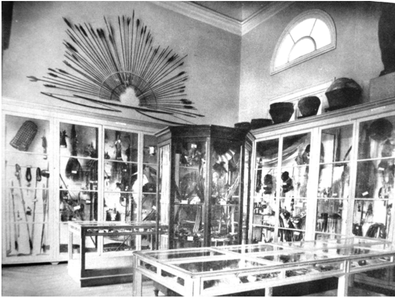
Figura 3. Etnografia Brasileira (Sala B-12).