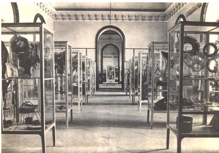
Figura 2. Vista da Sala Gabriel Soares, ao fundo Sala Broca.