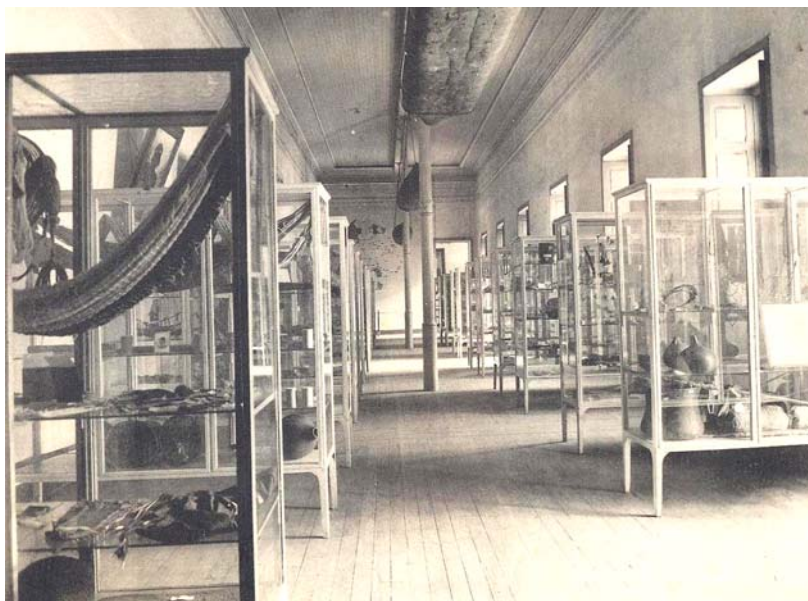
Figura 5. Sala Castelnau, Etnografia do Brasil. A imagem da sala dá uma mostra da visão interna do edifício nesse momento.

Pelos critérios utilizados por Roquette-Pinto na reformulação da sala Etnografia Brasileira, do Museu Paulista e por sua aproximação com as teorias de Bastian e Ratzel é bastante provável que ele tenha dado prosseguimento ao arranjo das peças etnográficas do Museu Nacional conforme a distribuição geográfica das populações indígenas, associando-a aos aspectos linguísticos, ao invés das bacias hidrográficas proposta por Domingos de Carvalho. Inaugurava-se assim no Museu Nacional uma nova relação entre antropologia e discursos expositivos.