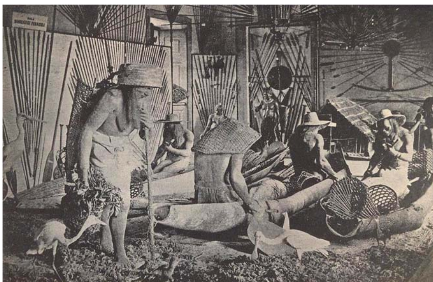
Figura 1. Exposição Antropológica de 1882.