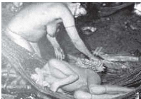
Figura 13: Mulher craô esfregando folhas de urtiga na filha ferroadada por um escorpião (Schultz, s.d.)

Na compreensão do mal, também como pressuposto da doença que antecede a morte temida, destacou-se a concepção mítica do anhang (Uggé, s.d.), uma entre as muitas entidades míticas indígenas defendidas pelo pajé e rudemente demonizadas pelo colonizador. Por sua vez, Esteves (2007, p.4) amplia a compreensão do significado simbólico desse personagem mítico, por ele grafado ahiaq kag : “Etimologicamente significa cabeça de visagem e serve para identificar instrumentos como: computador, filmadora, gravador, TV e rádio. Este termo é aplicado geralmente para instrumentos que provocam algum tipo de som ou que são estranhos para o lugar”.