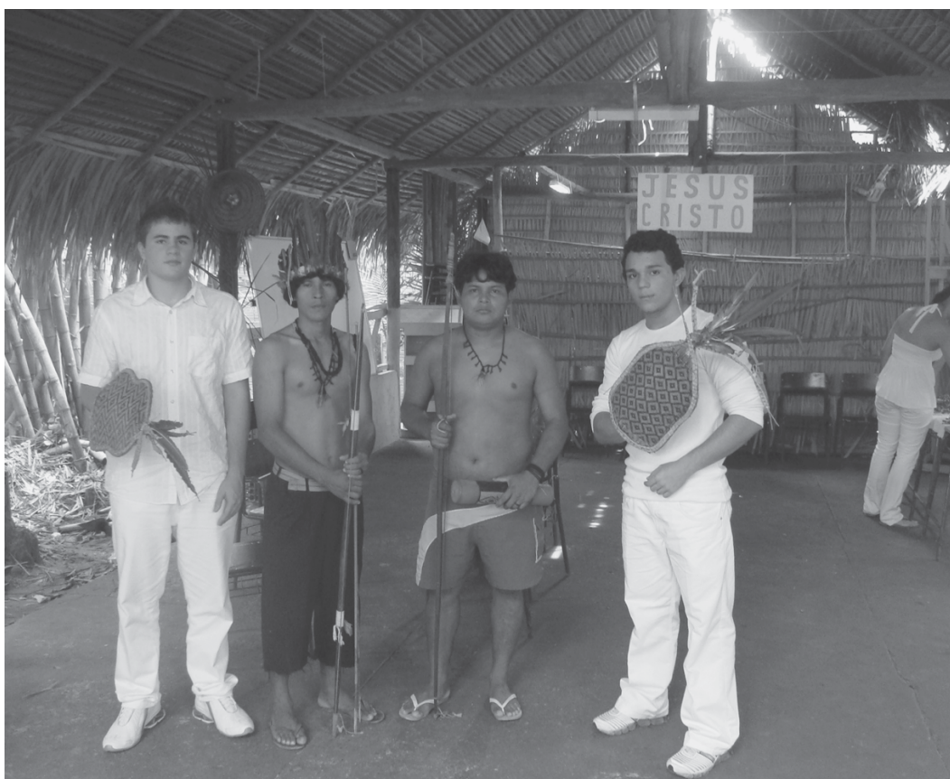
Figura 12: Presença neopentecostal na arena do Ritual da Tucandeira (Silva et al., 2008)

A proximidade da igreja neopentecostal, frequentada por alguns adultos da comunidade Y'Apirehyt, pode ter contribuído para a redução da importância do pajé, atualmente, e para a releitura do Anhang ou Ahiag Kag , antes demonizado pelo elemento colonizador católico e agora interpretado pelos protestantes como anúncio do mal e da manifestação demoníaca, que só pode ser combatido com orações e cantos de louvor. Por sugestão de um pastor, uma placa de madeira marcando a presença de Jesus Cristo foi fixada na viga de sustentação da cobertura de palha do galpão onde ocorre o Rito da Tucandeira (Figura 12). Assinale-se, porém, que a mesma é retirada durante o referido ritual.