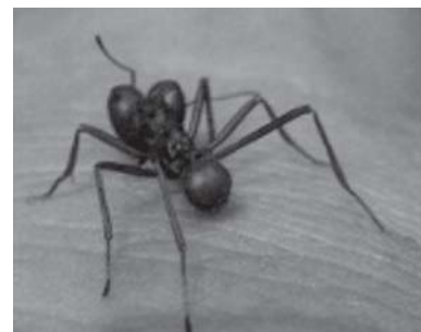
Figura 6: Formiga tucandeira ( Dinoponera grandis ) (Silva et al., 2008)

Na construção mítica, o Ritual da Tucandeira é oferecido pelo Tatu-Grande, Sahu-Wato, o que valoriza as relações com a terra e com a sexualidade. As formigas tucandeiras ou tocandiras ( Dinoponera grandis ), medindo entre 2,2cm a 2,5cm, provocam ferroadas dolorosas (Figura 6). O cantor ( wepyhat ) é também o dirigente do ritual. Na noite da véspera, as formigas são colocadas em recipiente com folhas do cajueiro, o que as faz adormecerem. No dia seguinte, são retiradas do recipiente e colocadas, com o abdome e o ferrão na parte interna e a cabeça de fora, na luva de fibras com elementos que simbolizam animais. Ao acordarem esses insetos se tornam agressivos, mexendo continuamente os ferrões. De acordo com o mito, as formigas estão relacionadas aos pelos pubianos da sedutora mulher-cobra existente no reino subterrâneo, e foram trazidas ao mundo sateré-mawé pelo Tatu-Grande. Na construção mítica, a luva adornada de penas representa a vagina e os pelos pubianos da mulher-cobra.