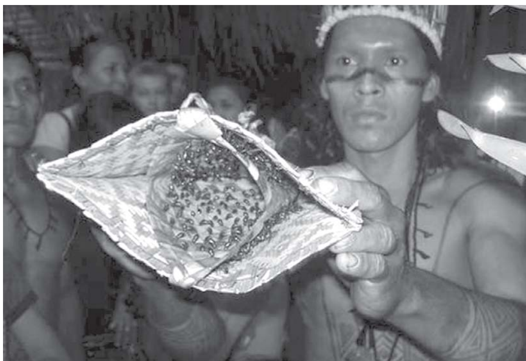
Figura 4: Luva do Ritual da Tucandeira (Silva et al., 2008)

Então hoje nós entendemos, a tucandeira é uma tradição, é um valor que nós temos, mas também, por outro lado, a tucandeira é daqui da terra, digamos assim, não é divina, não é aquilo que você pode adquirir, a paz. A tucandeira, você não vai adquirir a felicidade por outro lado. A tucandeira, ela é muito material, ela é muito terrena. Por que eu quero dizer isso? A tucandeira, lá, foi feito para preparar fisicamente o homem, meter a mão, ficar com saúde, sadio total. Mas só que no meio dessas ... eu não sei, se fizesse outro tipo de festa de tucandeira, talvez isso poderia sobreviver, mas só que, até hoje, a festa da tucandeira, ela é muito misturada. Como? Coisas terrenas (Kapfhammer, 2004, p.112).