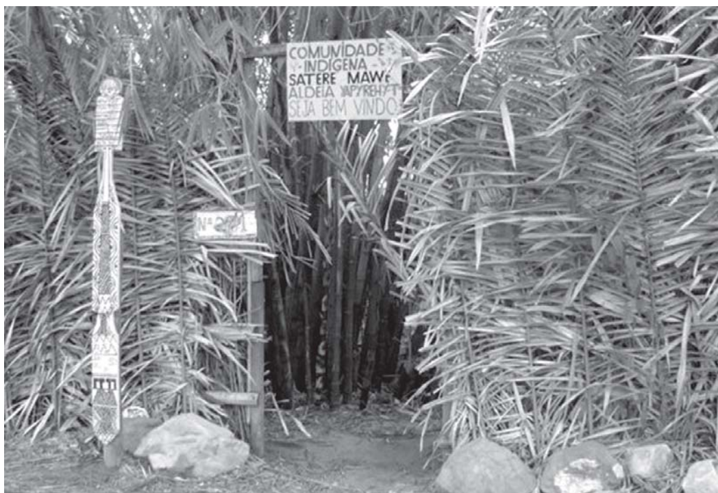
Figura 8: A entrada da comunidade Y'Apirehyt, na periferia da cidade de Manaus (Silva et al., 2008)

A nossa comunidade já vem de muito tempo, desde 1990. Minhas tias foram as primeiras que lutaram por essa área onde estamos. Enfrentamos muitas dificuldades para ficar nessa área, quando foi envolvido o Ministério Público, a Sedema, a Urbam, a Funai. Diante disso, o pessoal do conjunto habitacional Santos Dumont não queria que nós ficassemos na área, achavam que íamos fazer favela, roubar. Através do diálogo com esses órgãos, ouvindo que nós queríamos um local para trabalhar e fazer nosso artesanato e manter nossa cultura dentro de Manaus, concordaram e deixaram os sateré-mawé nesse local, pediram para não desmatar e não degradar a área. Fizemos, até hoje preservamos. Hoje, a comunidade cresceu muito (Almeida, Santos, 2008, p.122).