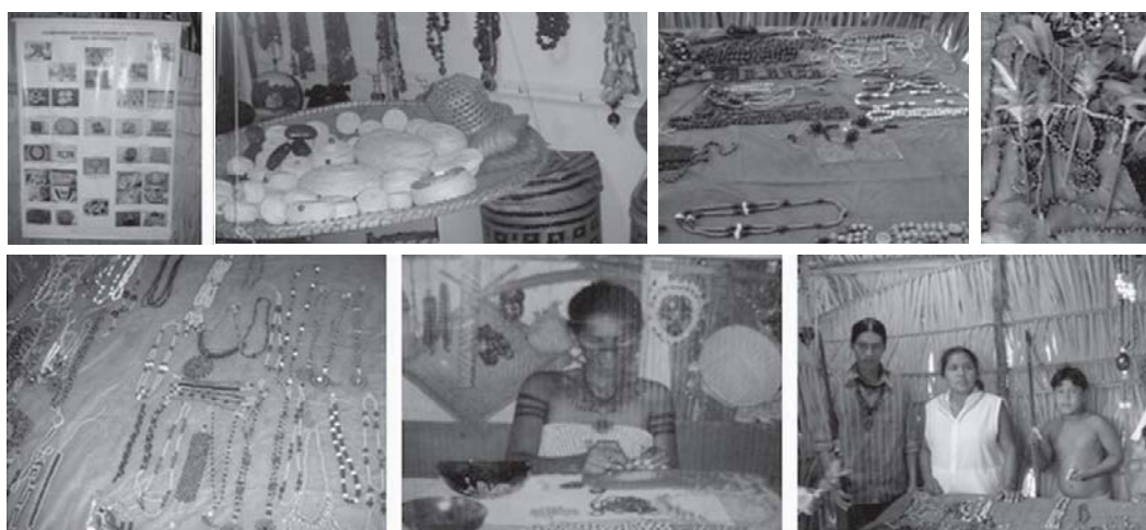
Figura 11: Exposição de artesanato da comunidade Y'Apirehyt para turistas e visitantes (Silva et al., 2008)