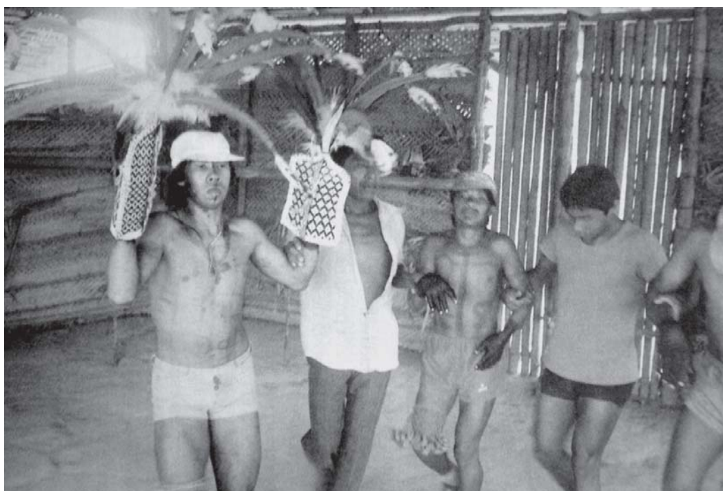
Figura 7: Ritual da Tucandeira na aldeia do Manga (Lorenz, 1992, p.45)

Por isso o aracu é pintado O peixe pintou o filho Por isso o peixe piranha é pintado O peixe pintou o filho (repete várias vezes) Com a primeira água, teve o início da tucandeira O peixe pintou o filho (repete várias vezes) Por isso o peixe puraqué pintou-se O peixe pintou o filho (repete várias vezes) ... Haté jogou o jacaré (repete várias vezes) Para vingar os peixes, Hate jogou jacaré (repete várias vezes) ... (Esteves, 2007, p.43).