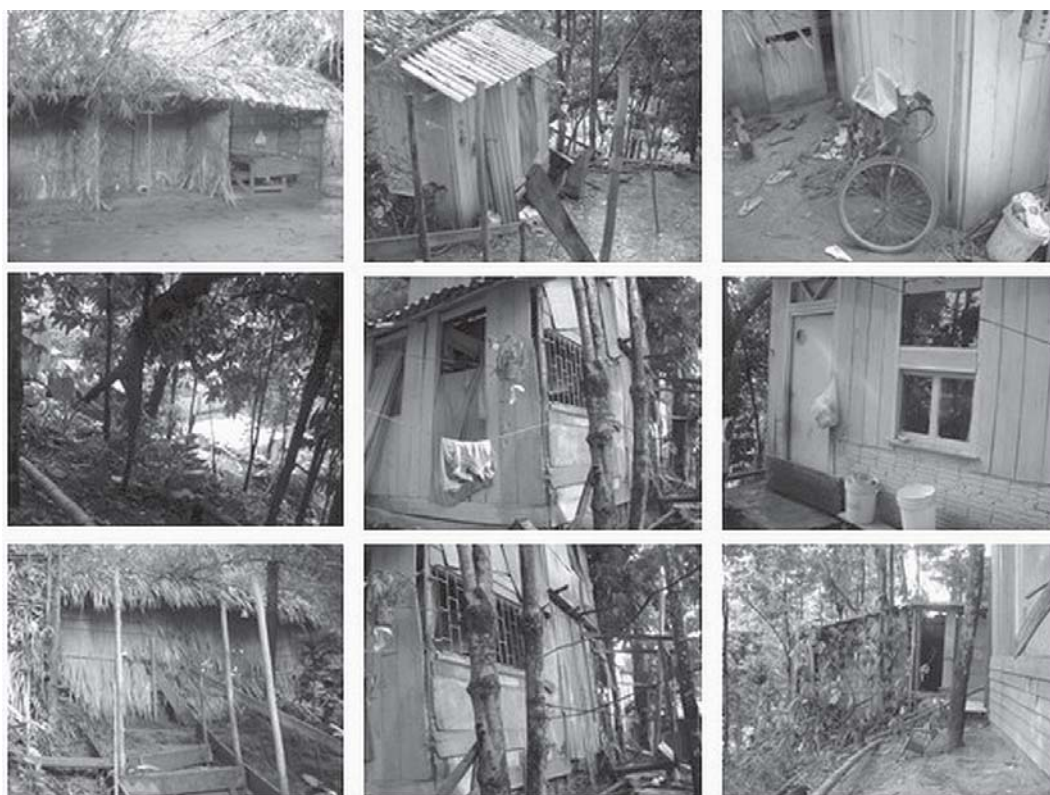
Figura 9: Características das moradias da comunidade sateré-mawé Y'Apyrehyt (Silva et al., 2008)

Alguns homens da comunidade Y'Apyrehyt trabalham na prestação ocasional de serviços na cidade, sobretudo na montagem de coberturas de galpões com palha da palmeira de inajá. A maior parte da renda financeira advém dos turistas que visitam a comunidade – incluída nos anúncios das empresas de turismo –, interessados em conhecer o Ritual da