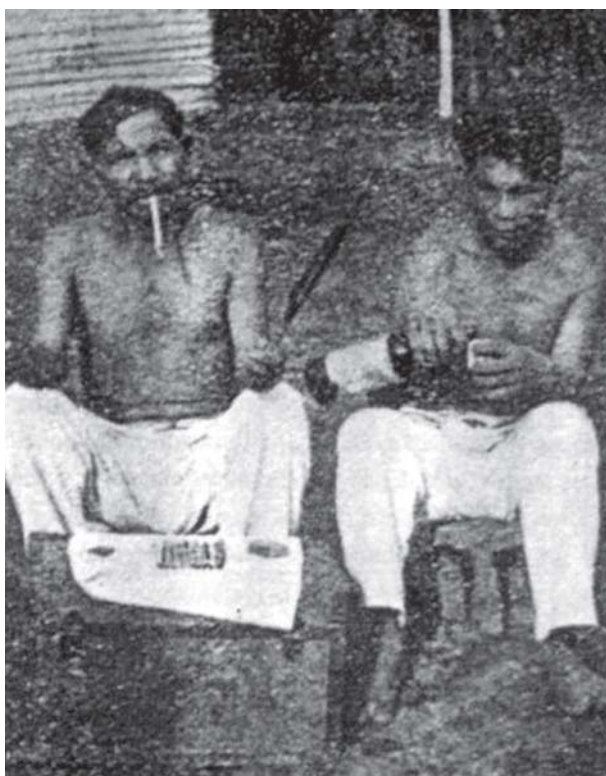
Figura 15: O pajé registrado por Nunes Pereira (2003, p.88)

pajé. O foco principal dessa crítica consiste no fato de o pajé identificar a enfermidade como resultado de um ‘ato mágico danoso’. Nesse sentido, no ritual de cura, o diagnóstico da doença envolve a identificação de ‘quem a causou’, seja por meio de feitiços ou de outras formas de encantamento. Para os Sateré-mawé evangélicos, essa posição da pajelança tem repercussões fortes no grupo, uma vez que sempre enseja vingança, ódio e conflitos entre os parentes. Por essa razão, o pajé não é bem-vindo entre os Sateré-mawé evangélicos.