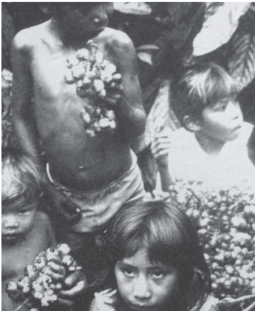
Figura 3: Índios sateré-mawé e o guaraná (Uggé, s.d., p.26)

Têm os Andirazes em seus matos uma frutinha que chamam de guaraná, a qual secam e depois pisam, fazendo delas umas bolas, que estimam como os brancos o seu ouro, e desfeitas com uma pedrinha, com que as vão roçando e em uma cuia de água bebida, dá tão grandes forças, que indo os índios à caça, um dia até outro, não têm fome, além do que faz urinar, tira febre e dores de cabeça e cãibras. Do préstimo que tem para provocar urina me consta; do mais não sei de certo senão pelo que comumente ouço dizer.