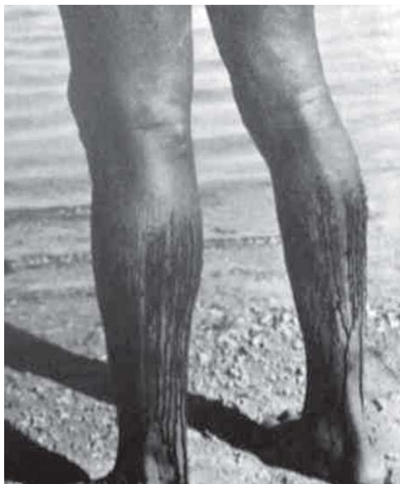
Figura 14: A prática da sangria (Schultz, s.d.)