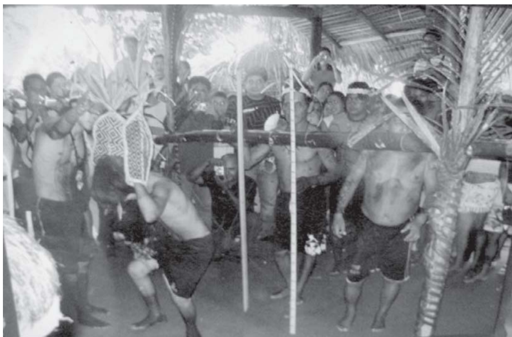
Figura 10: Cena do Ritual da Tucandeira na comunidade Y'Apirehyt, em dia e hora previamente marcados com empresas de turismo (Silva et al., 2008)

Nessa comunidade há vários anos não há rito de pajelança, e poucos falam sobre o poratin , apesar de ele estar presente em sua entrada, conforme se vê na Figura 8. O único pajé que lhes assistia retornou às terras ancestrais, na reserva localizada no município de Maués.