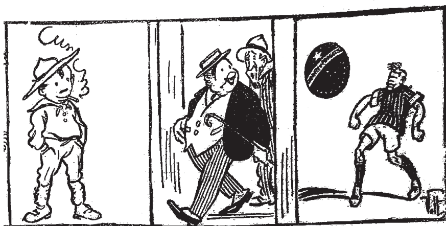
Figura 1: Semana dos símbolos da nação (Semana..., 26 set. 1922)

Mesmo assim, comentou Sant’Anna (13 set. 1922), essa supremacia política, econômica e cultural não correspondia ao papel de São Paulo na administração do esporte, que “não representa nas suas relações externas a sombranceria dos bandeirantes”.