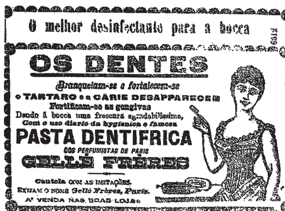
Figura 4: An3ncio de pasta dent3frica (O Com3rcio..., 26 nov. 1899, p.3)

Enquanto n3o h3 qualquer alerta de m3dicos ou autoridades sanit3rias para a necessidade de higiene oral, foi nos an3ncios que se encontraram