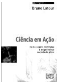
Bruno Latour Ciência em ação: como seguir cientistas e engenheiros sociedade afora São Paulo, UNESP, 2000.

Socióloga, mestre em ciências, pesquisadora-visitante do convênio Fiocruz/Faperj Escola Politécnica de Saúde Joaquim Venâncio Av. Brasil, 4365 Manguinhos 21045-000 Rio de Janeiro — RJ Brasil marciat@fiocruz.br/marciat23@hotmail.com