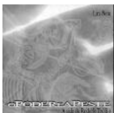
Lira Neto O poder e a peste Fortaleza, Fundação Demócrito Rocha, 1999, 223p.

Graduada em história Praia do Flamengo, 122/608 22210-030 Rio de Janeiro – RJ Brasil nathacha_@hotmail.com