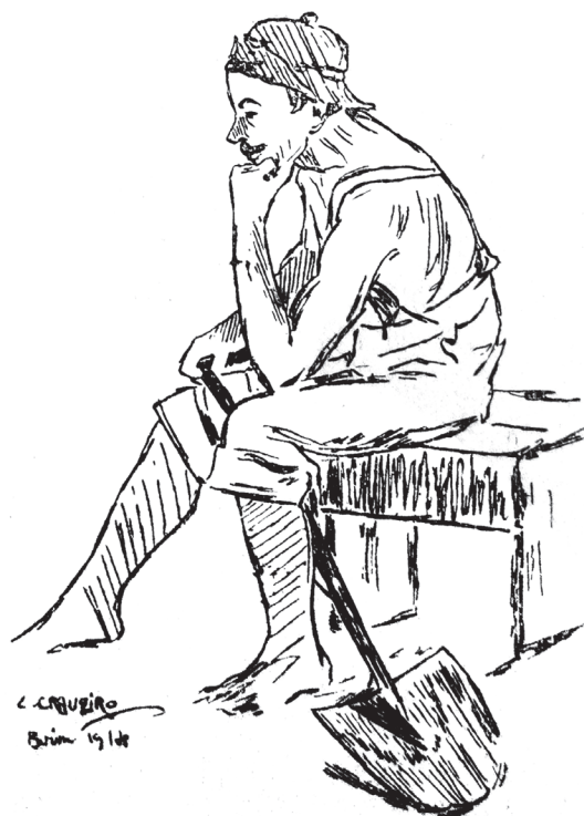
Figura 4: Caricatura de Craveiro, por Cândido Craveiro