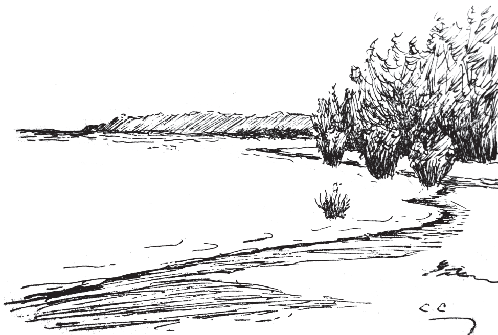
Figura 2: Praia em Boim, desenhada por Cândido Craveiro (Fonte: Craveiro, 1915a, p.151)

Cândido Craveiro valorizou o banho matinal, “uma das coisas mais agradáveis que aqui temos”, a canoagem, os passeios a pé e salientou a relevância do naturismo, em especial por meio do exemplo de Gameiro, que já ultrapassara os 70 anos e havia rejuvenescido, caminhando, trepando a árvores e dedicando-se à agricultura. Declarou ainda que valeria a pena pensar na exploração das bagas de saponina – sem indicar de que planta provinham, eventualmente Sapindus saponaria –, pois forneciam o “verdadeiro sabonete naturista”. Finalmente, deu conta das suas preferências alimentares: saladas de cariru e de maxixe e açaí tomado puro ou com farinha (Craveiro, 1915a, p.152).