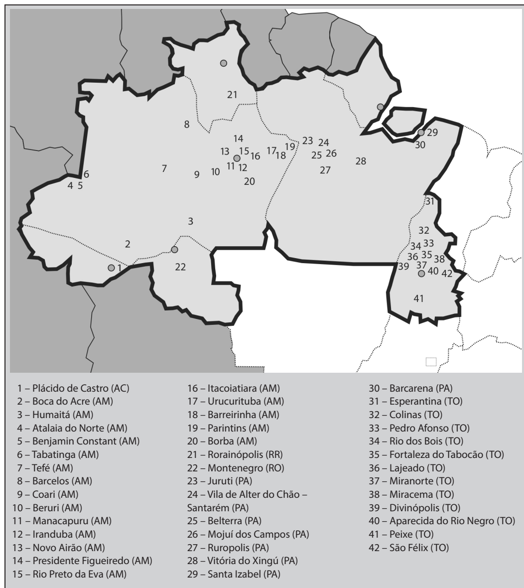
Figura 1: Municípios que contam com internato rural na Amazônia, 2013 (Silveira, 2014)

Em algumas experiências, como a da Universidade do Estado do Amazonas (UEA) e da Universidade Federal do Tocantins (UFT), são formadas equipes multidisciplinares para a realização do estágio rural com integração de alunos de medicina, enfermagem e odontologia. Essa característica pode contribuir para a diminuição das tensões existentes entre as profissões, muitas vezes desde a universidade. Embora sendo o ambiente propício para promover interface entre os cursos, a maioria das universidades não a realiza, permanecendo somente os estágios na área médica ou em outros cursos de maneira independente.