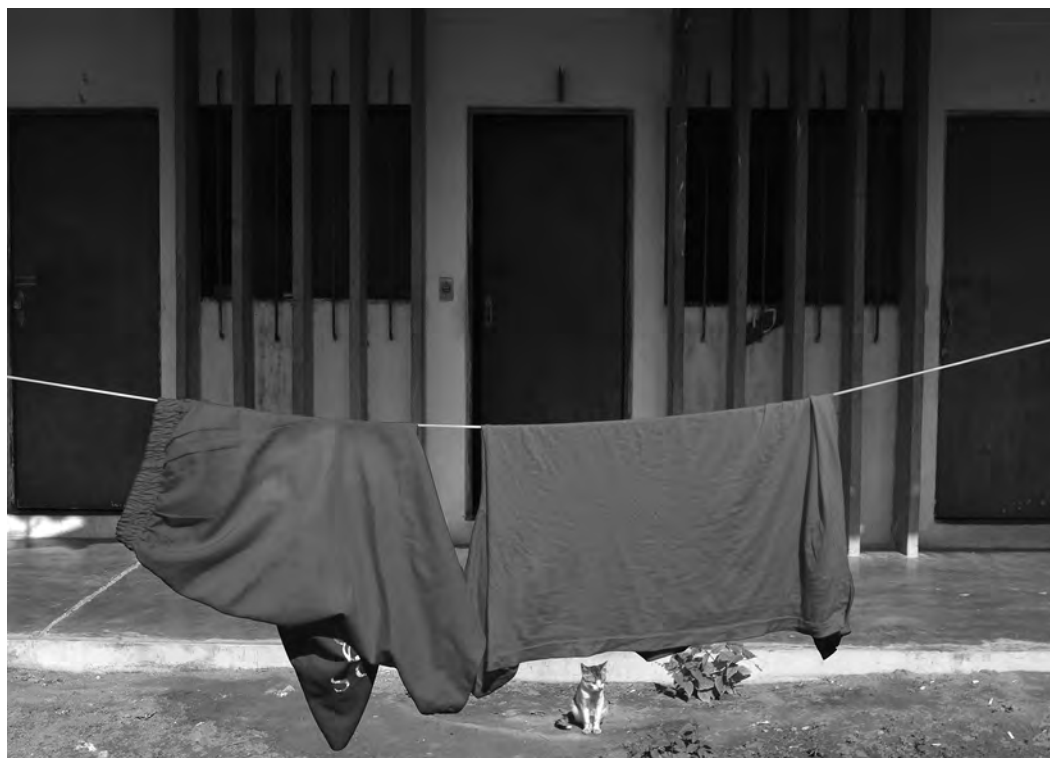
Figura 1: Roupas no varal, 2004