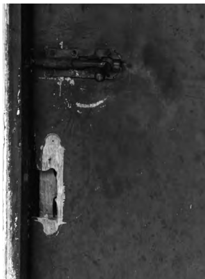
Figura 2: Tranca, 2004

Além do dossiê, da conversa com Zefinha e da entrevista com o diretor, recuperamos cópia do processo penal. Este conjunto de documentos – dossiê do manicômio judiciário, processo judicial, entrevistas e fotografias – compõe o corpus judiciário de Zefinha. Omitimos os nomes dos peritos psiquiatras e juizes que determinaram a permanência de Zefinha no hospital, muito embora as informações sejam de acesso público. A pesquisa foi revisada por um comitê de ética em pesquisa.