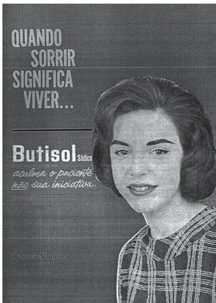
Figura 2: Propaganda da indústria farmacêutica ( Boletim Bibliográfico FMUSP , v.3, n.1, p.10, 1964)

Outro excerto indica que as “dificuldades materiais paralelas ao crescimento da publicação levaram-nos a aceitar a publicidade de produtos farmacêuticos, a ser inserida fora do texto. Colocada rigorosamente dentro de padrões éticos e científicos e conformada ao tipo gráfico da publicação, terá a vantagem de emprestar à revista certo caráter decorativo” (Martins, 1963b, p.100).