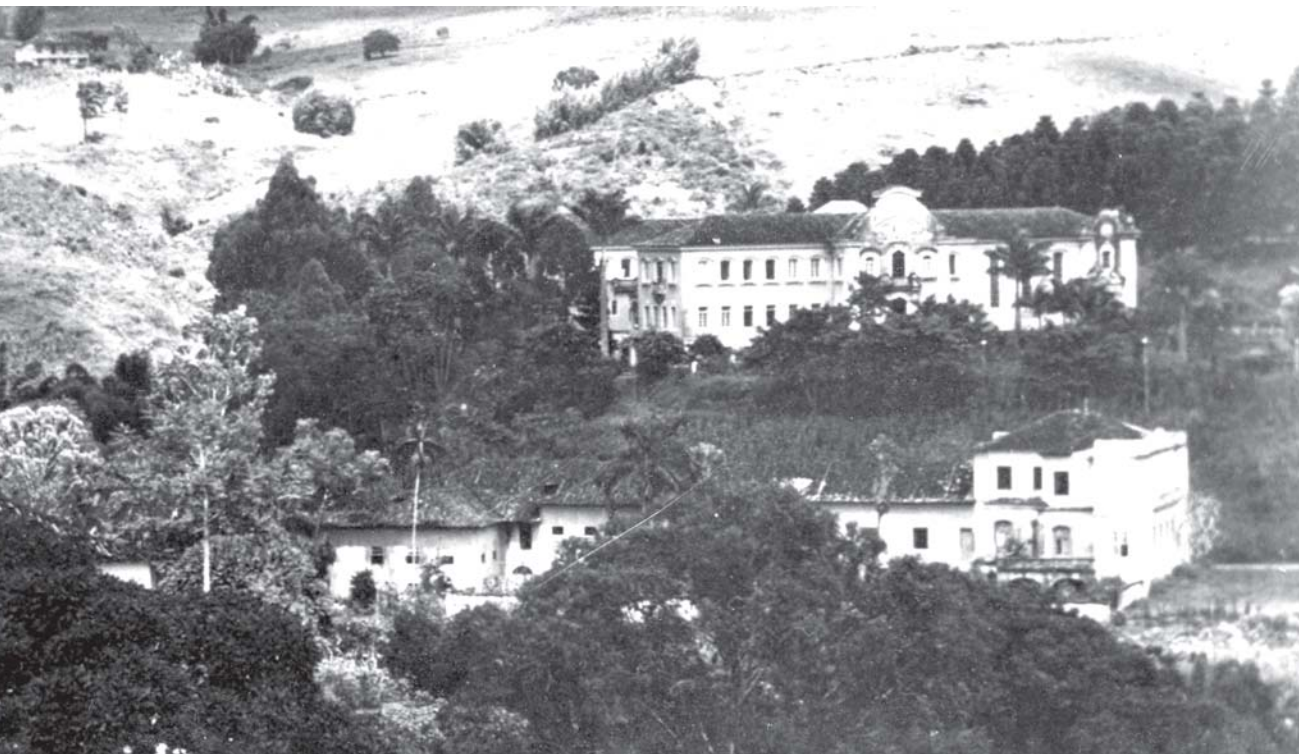
Figura 4: Antigo Palácio dos Bispos de Mariana tendo ao fundo o Seminário Maior São José, s.d., s.autor