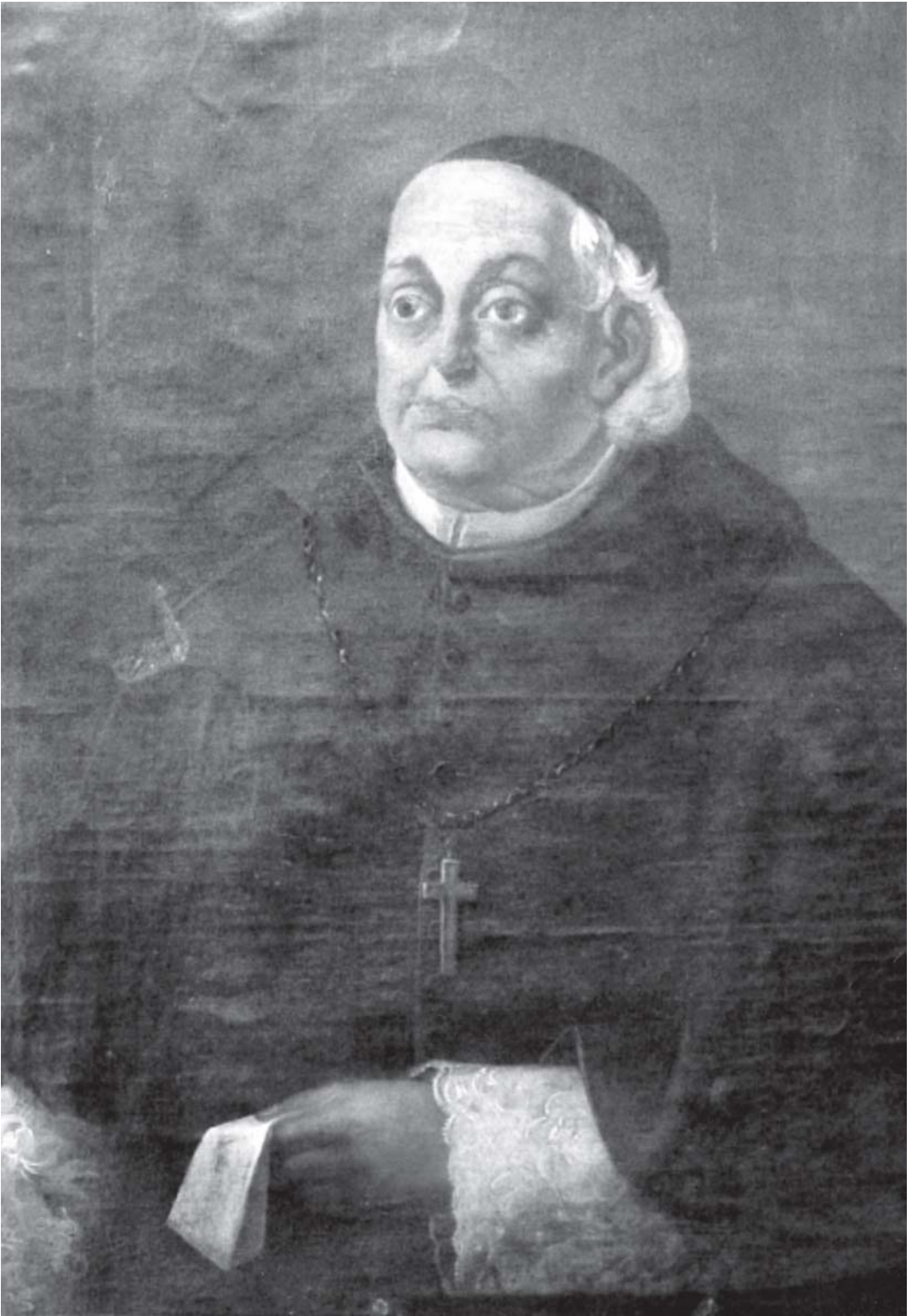
Figura 1: O bispo dom frei Cipriano de São José, s.d., s. autor. Foto Márcio Eustáquio de Souza (Museu de Arte Sacra de Mariana)