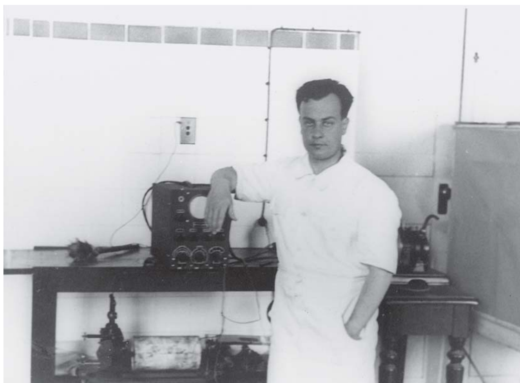
Figura 3: Carlos Chagas Filho ao lado do oscilógrafo catódico (aparelho de medida elétrica) no Laboratório de Biofísica. Rio de Janeiro, ca. 1942.