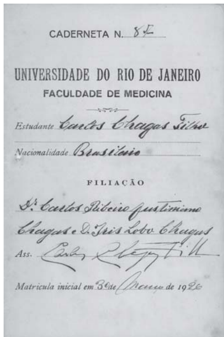
Figura 1: Caderneta de anotações do estudante de medicina Carlos Chagas Filho. Rio de Janeiro, 1931.