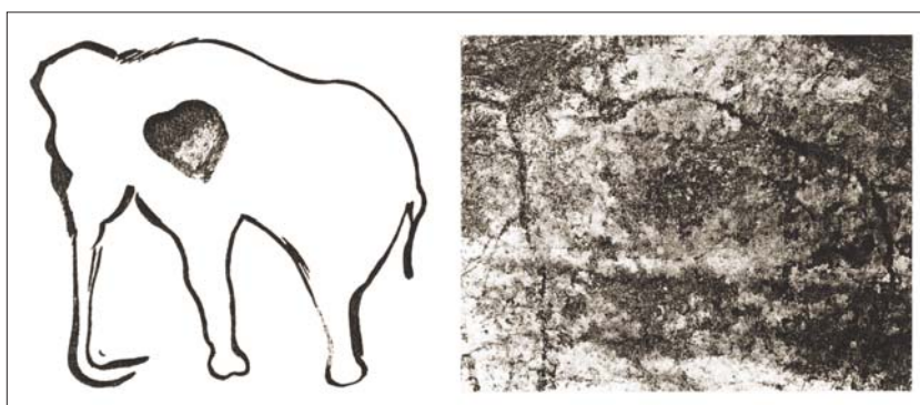
Figura 5. Desenho da era paleolítica representando um mamute.

copa em espanhol, coppa em italiano e copas em português, do latim vulgar cuppa , 'taça'. O que parece é que inicialmente os naipes franceses simbolizavam as classes sociais: as espadas e as lanças, a nobreza; o trevo de paus o campesinato; o ladrilho, carreau (quadrado em francês), diamond (losango em inglês) e 'ouros' em português, a classe dos comerciantes, e as 'copas' (taças) representavam o clero, gens de coeur . Choeur tornou-se coeur , vindo daí o símbolo do coração nas cartas (Boyadjian, 1980; Enciclopedia Mirador Internacional, 1982) (Fig. 6).