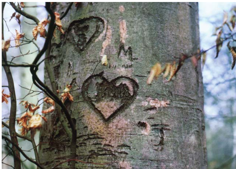
Figura 7. O símbolo do coração gravado significando amor.

Não deixa de ser curiosa a origem do símbolo e a finalidade para a qual foi criado.