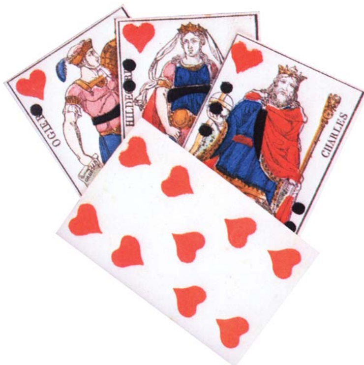
Figura 6. Cartas com o naipe copas, em forma de coração.