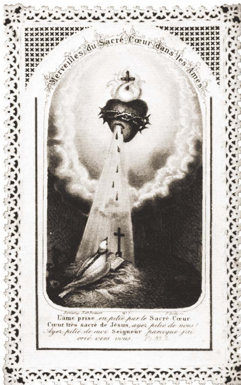
Figura 4. Imagem do Sagrado Coração de Jesus.

A presença do símbolo nas cartas do baralho também é um fato curioso. Ela é atribuída aos franceses. Coeur em francês deu heart em inglês e hertz em alemão. No entanto, esse naipe é conhecido por