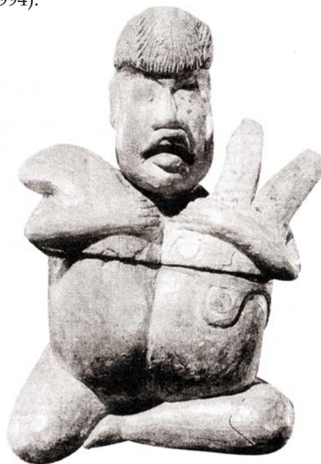
Figura 1. Vaso da cultura Olmeca com formato de coração, 1200-900 a.C.

No tempo dos babilônios houve um esforço por aqueles que praticavam a medicina, em separar os conhecimentos médicos, da magia e da religião, como comprovam os documentos em escrita cuneiforme encontrados nas ruínas do palácio de Assurbanipal (669-633 a.C.). O coração foi estudado e descrito, não se distinguindo as artérias das veias, con-