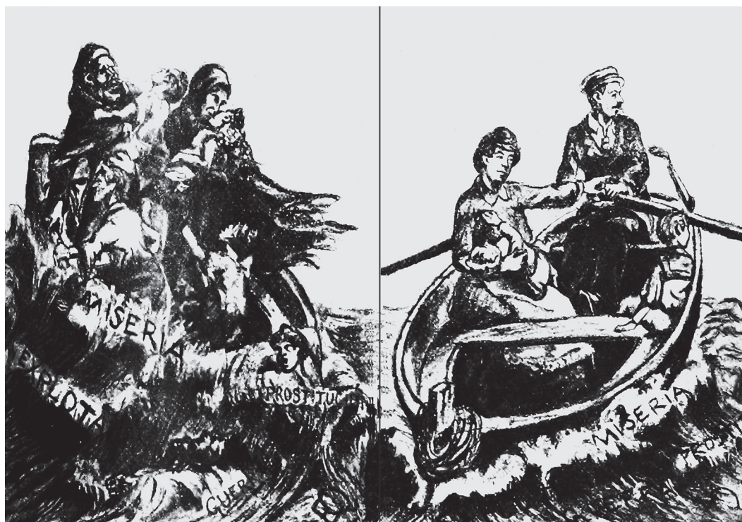
Figura 1: Portada ( Salud y Fuerza , 1906b, p.65)