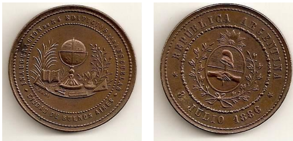
Figura 4 - Vista de las monedas conmemorativas.