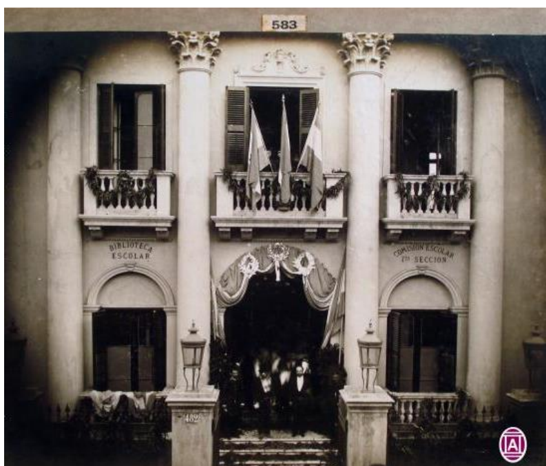
Figura 2 - Vista de una de las 14 escuelas inauguradas por Julio A. Roca en 1884.

Entre la inauguración de la escuela catedral al Sud y los 40 edificios de 1886, tuvieron lugar dos acontecimientos importantes en materia de edificación escolar: la construcción de la escuela de Catedral al Norte en 1860 y el estreno de 14 edificios escolares durante 1884 (Fig. 2). La escuela de Catedral al norte fue construida por el arquitecto Miguel Barabino siguiendo las indicaciones de Sarmiento; se trataba del primer edificio construido en la ciudad diseñado para funcionar como escuela graduada. Según las crónicas de la época, 5.000 niños desfilaron el día en que se colocó su piedra fundamental.