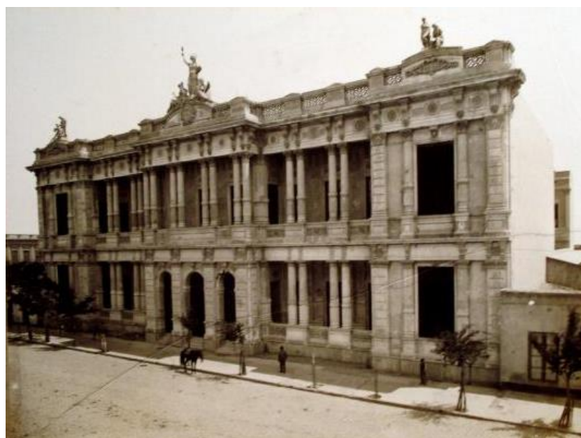
Figura 3 - Vista de la fachada de la escuela graduada de niñas de la calle Callao, entre Corrientes y Lavalle, 1886.

biblioteca, portería, gimnasio, habitaciones para el preceptor, letrinas y dos patios”. Sobre el estilo arquitectónico, el “edificio en su arquitectura no obedece a las reglas exigidas por la pureza de un estilo determinado. No obstante reviste formas esbeltas y una agradable perspectiva.” La evaluación que hacía de la escuela, finalmente, lo llevaba a considerar que “La distribución parece acertada, y las reglas de higiene bien consultadas, su costo no excede de $120.000, incluso el valor del terreno”. (EL MONITOR..., 1886, p. 99) (Fig. 3).