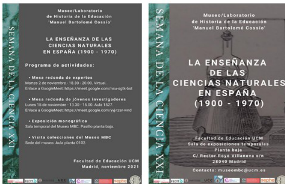
Figura 2 – Cartel Semana de la Ciencia. 2021. La enseñanza de las Ciencias Naturales en España (1900-1970). 12

Fuente: Elaboración propia del Museo Complutense de Educación.