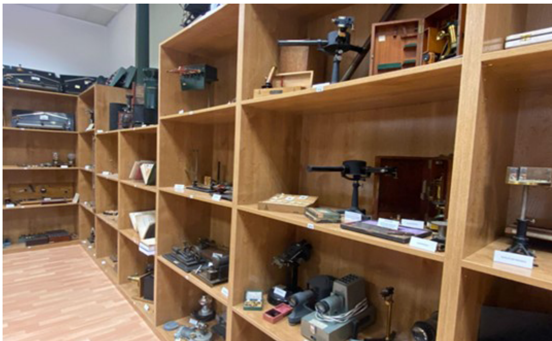
Figura 5 – Segunda sala del Museo Complutense de Educación y vista parcial de la Colección de instrumentos para la didáctica de las ciencias experimentales.