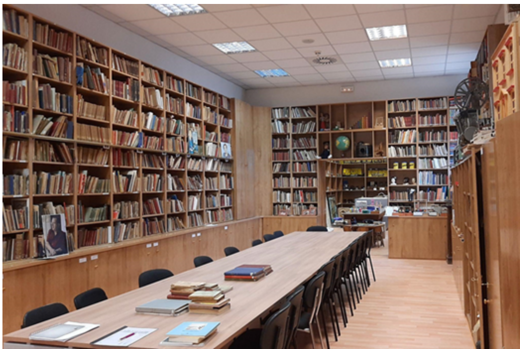
Figura 1 – Primera sala del Museo Complutense de Educación.

Gran parte del patrimonio histórico educativo de este colegio se encuentra en la primera sala del MCE, que constituye el espacio principal o lugar de trabajo en el que se desarrollan las actividades de consulta e investigación, así como las actividades docentes, principalmente los seminarios de investigación de historia de la educación, y las tareas de recuperación y catalogación de los fondos del museo (Figura 1).