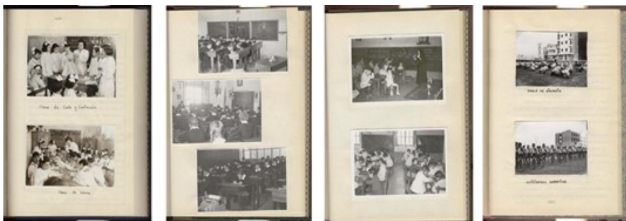
Figura 3 – Archivo fotográfico del Fondo Romero Marín (FRM).