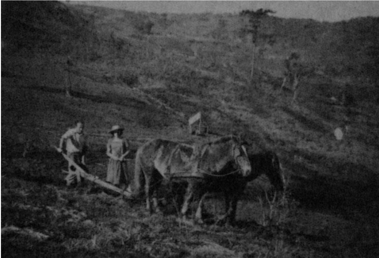
Figura 1 – preparação do terreno para o Plantio de trigo. Colônia Marechal Hindemburgo (atual Dez de Novembro, município de Fraiburgo), na década de 1930. Notem a floresta devastada ao fundo.