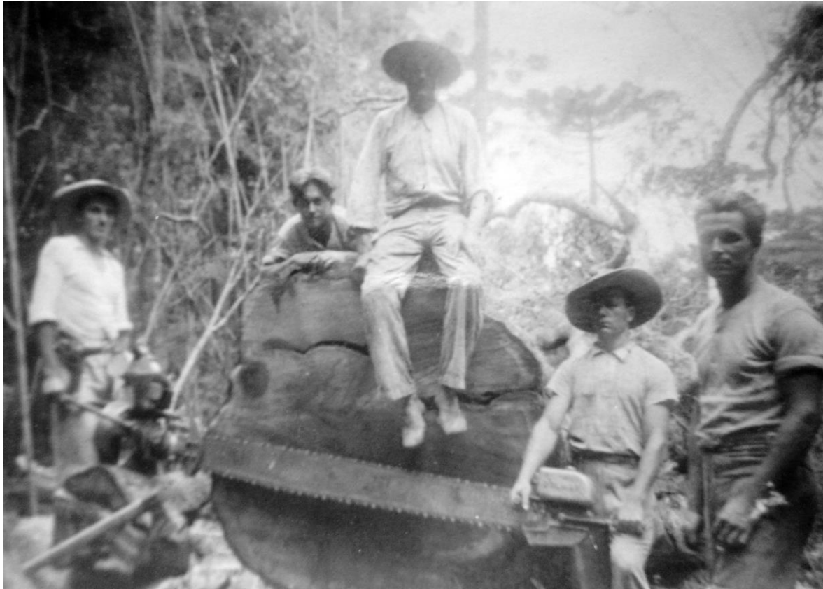
Figura 2 – imbuia centenária derrubada por uma motosserra da serraria René Frey & Irmão no ano de 1946.

A colonização e exploração madeireira fizeram com que a paisagem predominante das áreas compreendidas pela floresta, que formavam a chamada “roça cabocla”, sofresse intensas transformações. Em curto intervalo, como demonstra Cesco (2004, p. 119), o processo seria responsável por introduzir o que seriam o “progresso” e o “desenvolvimento” na região – atividades que em pouco mais de duas décadas deixaram marcas profundas tanto na paisagem quanto no destino de diversas famílias excluídas do acesso e uso dos espaços e recursos naturais.