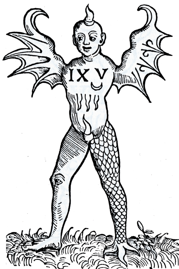
Figura 1 – Monstro de Florença/Ravenna (1512) (detalhe). Panfleto germânico. Bayerische Staatsbibliothek.

A fonte de Sanudo foi a correspondência do embaixador veneziano em Roma, Francesco Foscari (1460-1518), datada de 18 de março. Na passagem, demarca-se explicitamente que o Monstro havia sido “butato a stampa”, primeiro em Roma, de onde partiram as informações, mas provavelmente em Veneza, logo em seguida (NICCOLI, 1990, p. 45). Nele, porém, a éfrase sequer aparece. Supõe-se apenas que teve em mãos uma imagem do monstro “nato in Ravenna”, a exiguidade do registro não admitindo qualquer interpretação, salvo a ênfase na origem romana (“mi fo mandato di Roma”), e não florentina, da imagem. Por outro lado, isso reafirma a dinâmica que animava o circuito das gravuras teratológicas: os três viram imagens da criatura (Tedallini, em 8 de março; Landucci, em 11 de março; e Sanudo, em 23 de março), rapidamente disseminadas logo após a pretensa origem do fenômeno. Embora não conheçamos as imagens italianas, podemos, portanto, inferir a existência de um ou mais arquétipos icônicos, do qual um panfleto germânico impresso em 1512 (Figura 1) é também testemunha. 23