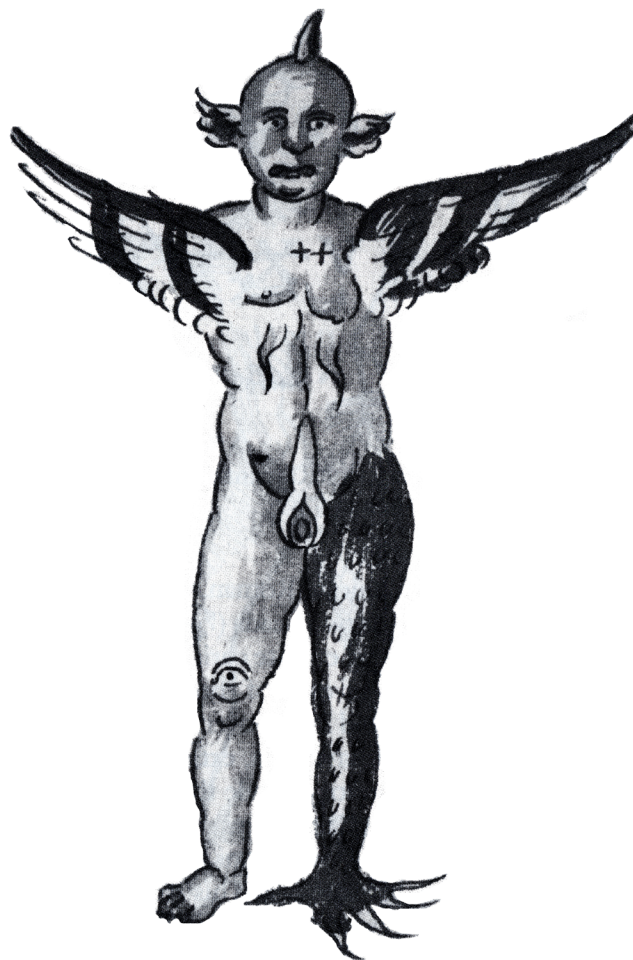
Figura 2 – O Monstro de Florença (1506) (detalhe). Biblioteca Marciana, Veneza.