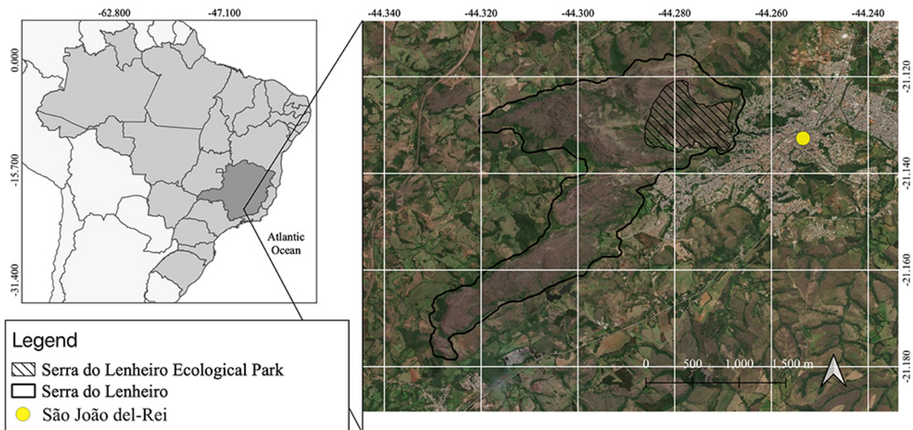
Figura 1. Mapa de localização da Serra do Lenheiro, Estado de Minas Gerais, Brasil.