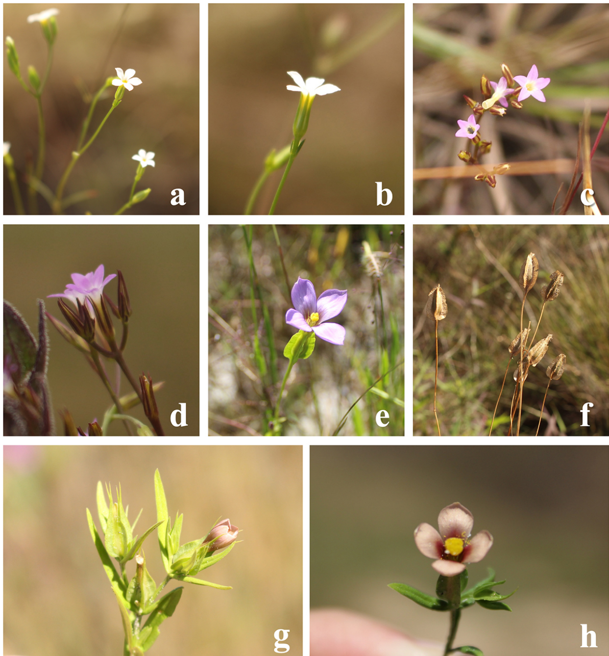
Figura 3. Espécies de Gentianaceae registradas na Serra do Lenheiro, Estado de Minas Gerais, Brasil. Curtia tenella (Mart.) Cham.: a. flores em cimeiras. b. detalhe de uma flor em vista lateral. Curtia tenuifolia (Aubl.) Knobl.: c. flores em cimeira. d. detalhe de uma cimeira em vista lateral. Schultesia gracilis Mart.: e. flor. f. frutos. Schultesia guianensis (Aubl.) Malme: g. cimeiras. h. flor em vista frontal.

Figure 3. Gentianaceae's species registered at Serra do Lenheiro, Minas Gerais State, Brazil. Curtia tenella (Mart.) Cham.: a. flowers in cymes. b. flower detail in lateral view. Curtia tenuifolia (Aubl.) Knobl.: c. flowers in cyme. d. cyme detail in lateral view. Schultesia gracilis Mart.: e. flower. f. fruits. Schultesia guianensis (Aubl.) Malme: g. cymes. h. flower in frontal view.