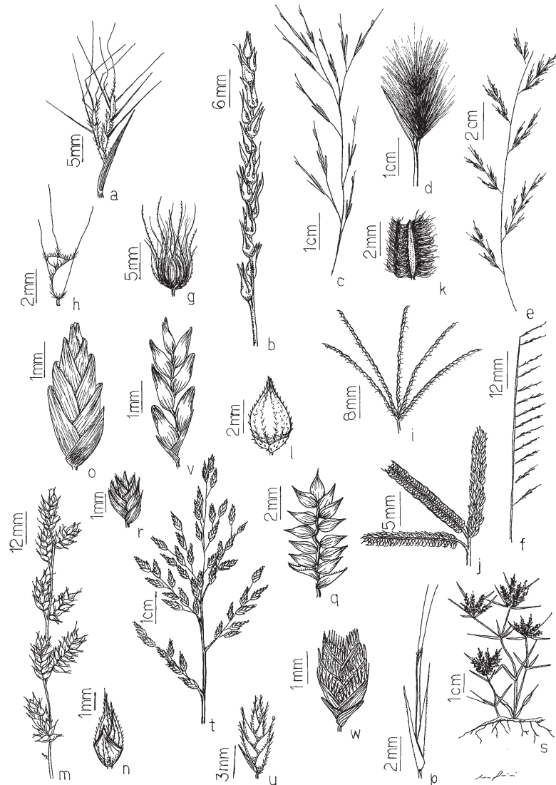
Figura 1. Espécies de Poaceae da Estação Ecológica do Seridó, RN, Brasil. a. Andropogon angustatus , ramos da inflorescência. b. Anthephora hermaphrodita , inflorescência. c. Aristida adscensionis , inflorescência. d. A. elliptica , inflorescência. e. Bouteloua americana , inflorescência. f. B. aristidoides , inflorescência. g. Cenchrus ciliaris , involucre de cerdas. h. Chloris barbata , antécios inferiores. i. Cynodon dactylon , inflorescência. j. Dactyloctenium aegyptium , inflorescência. k. Digitaria bicornis , espigueta. l. Echinochloa colona , espigueta. m-n. Echinochloa polystachya . m. inflorescência. n. espigueta. o. Eleusine indica , espigueta. p. Enteropogon mollis , espigueta. q. Eragrostis cilianensis , espigueta. r. E. ciliaris , espigueta. s. E. hypnoides , hábito. t-u. E. maypurensis . t. inflorescência. u. espigueta. v. E. pilosa , espigueta. w. E. tenella , espigueta. (a: Ferreira & Silva 276; b: Ferreira & Silva 278; c: Ferreira & Araújo 261; d: Ferreira et al. 287; e: Ferreira et al. 293; f: Ferreira & Araújo 247; g: Ferreira & Oliveira 3; h: Ferreira & Oliveira Irmão 37B; i: Ferreira 297; j: Ferreira et al. 289; k: Ferreira & Silva 271; l: Ferreira & Araújo 222; m-n: Ferreira 306; o: Ferreira & Araújo 241; p: Ferreira & Araújo 262; q: Ferreira et al. 290; r: Ferreira & Araújo 216; s: Oliveira et al. 1613; t-u: Ferreira & Silva 273; v: Ferreira 298; w: Ferreira & Araújo 246)

Figure 1. Species of Poaceae from the “Seridó” Ecological Station, Rio Grande do Norte, Brazil. a. Andropogon angustatus , branches of inflorescence; b. Anthephora hermaphrodita , inflorescence; c. Aristida adscensionis , inflorescence; d. A. elliptica , inflorescence; e. Bouteloua americana , inflorescence; f. B. aristidoides , inflorescence; g. Cenchrus ciliaris , involucre of bristles; h. Chloris barbata , lower florets; i. Cynodon dactylon , inflorescence; j. Dactyloctenium aegyptium , inflorescence; k. Digitaria bicornis , spikelet; l. Echinochloa colona , spikelet; m-n. E. polystachya . m. inflorescence. n. spikelet; o. Eleusine indica , spikelet; p. Enteropogon mollis , spikelet; q. Eragrostis cilianensis , spikelet; r. E. ciliaris , spikelet; s. E. hypnoides , habit; t-u. E. maypurensis . t. inflorescence. u. spikelet; v. E. pilosa , spikelet; w. E. tenella , spikelet. (a: Ferreira & Silva 276; b: Ferreira & Silva 278; c: Ferreira & Araújo 261; d: Ferreira et al. 287; e: Ferreira et al. 293; f: Ferreira & Araújo 247; g: Ferreira & Oliveira 3; h: Ferreira & Oliveira Irmão 37B; i: Ferreira 297; j: Ferreira et al. 289; k: Ferreira & Silva 271; l: Ferreira & Araújo 222; m-n: Ferreira 306; o: Ferreira & Araújo 241; p: Ferreira & Araújo 262; q: Ferreira et al. 290; r: Ferreira & Araújo 216; s: Oliveira et al. 1613; t-u: Ferreira & Silva 273; v: Ferreira 298; w: Ferreira & Araújo 246).