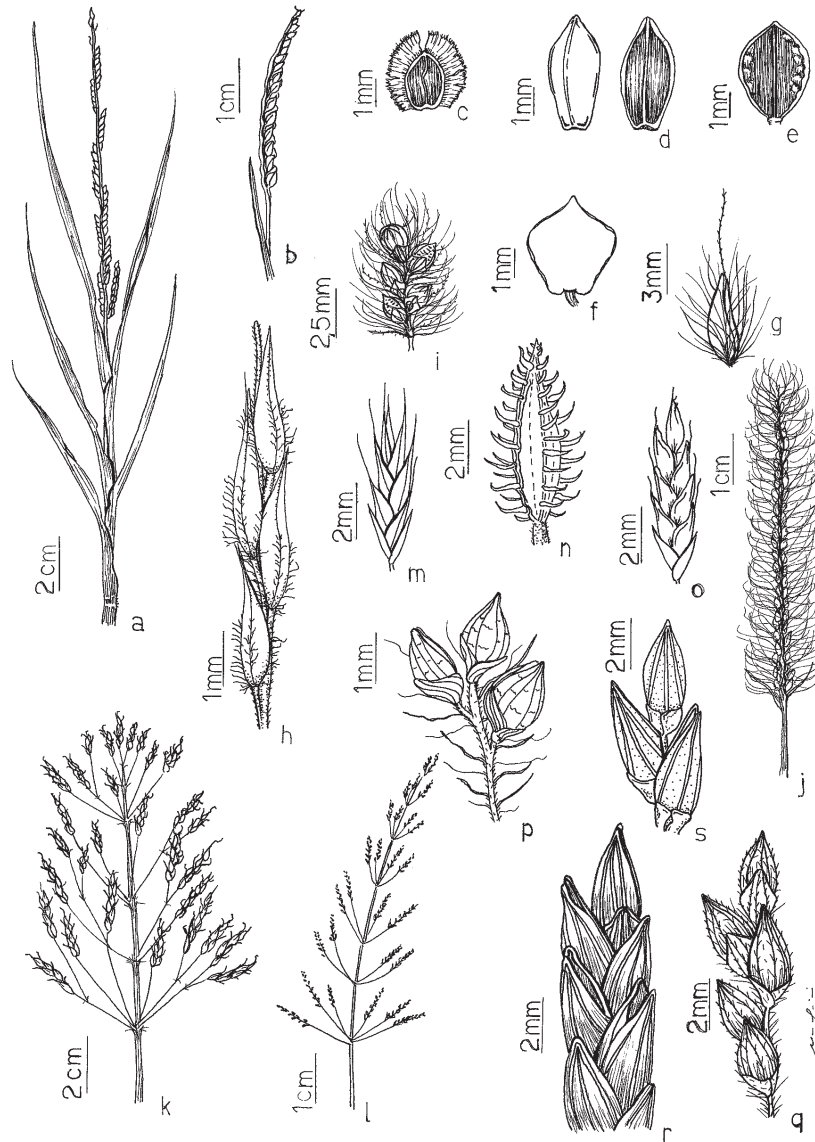
Figura 3. Espécies de Poaceae da Estação Ecológica do Seridó, RN, Brasil. a. Paspalidium geminatum , fragmento de um colmo. b. Paspalum clavuliferum , inflorescência. c. P. fimbriatum , espiguetas. d. P. ligulare , espiguetas vista dorsal e ventral, respectivamente. e. P. melanospermum , espiguetas. f. P. scutatum , espiguetas. g. Pennisetum purpureum , espiguetas e involucre de cerdas. h. Reimarochloa brasiliensis , espiguetas. i. Setaria parviflora , espiguetas. j. S. scandens , espiguetas. k. Sorghum arundinaceum , inflorescência. l. Sporobolus pyramidatus , inflorescência. m. Steirachne diandra , espiguetas. n. Tragus berteronianus , espiguetas. o. Tripogon spicatus , espiguetas. p. Urochloa fusca , espiguetas. q. U. mollis , espiguetas. r. U. mutica , espiguetas. s. U. plantaginea , espiguetas (a: Ferreira 303; b: Oliveira et al. 1880; c: Ferreira & Araújo 245; d: Ferreira & Araújo 218; e: Ferreira & Araújo 238; f: Ferreira & Araújo 239; g: Ferreira & Araújo 282; h: Ferreira 304; i: Ferreira & Araújo 189; j: Oliveira et al. 1894; k: Ferreira et al. 292; l: Oliveira & Ferreira 1668; m: Ferreira et al. 286; n: Ferreira & Araújo 248; o: Oliveira et al. 1898; p: Ferreira & Araújo 249; q: Ferreira & Araújo 234; r: Ferreira et al. 291; s: Ferreira & Araújo 243).

Figure 3. Species of Poaceae from the “Seridó” Ecological Station, Rio Grande do Norte, Brazil. a. Paspalidium geminatum , fragment of a stem; b. Paspalum clavuliferum , inflorescence; c. P. fimbriatum , spikelet; d. P. ligulare , spikelet, dorsal and ventral view, respectively; e. P. melanospermum , spikelet; f. P. scutatum , spikelet; g. Pennisetum purpureum , spikelet and involucre of bristles; h. Reimarochloa brasiliensis , spikelets; i. Setaria parviflora , spikelets; j. S. scandens , spikelets; k. Sorghum arundinaceum , inflorescence; l. Sporobolus pyramidatus , inflorescence; m. Steirachne diandra , spikelet; n. Tragus berteronianus , spikelet; o. Tripogon spicatus , spikelet; p. Urochloa fusca , spikelets; q. U. mollis , spikelets; r. U. mutica , spikelets; s. U. plantaginea , spikelets (a: Ferreira 303; b: Oliveira et al. 1880; c: Ferreira & Araújo 245; d: Ferreira & Araújo 218; e: Ferreira & Araújo 238; f: Ferreira & Araújo 239; g: Ferreira & Araújo 282; h: Ferreira 304; i: Ferreira & Araújo 189; j: Oliveira et al. 1894; k: Ferreira et al. 292; l: Oliveira & Ferreira 1668; m: Ferreira et al. 286; n: Ferreira & Araújo 248; o: Oliveira et al. 1898; p: Ferreira & Araújo 249; q: Ferreira & Araújo 234; r: Ferreira et al. 291; s: Ferreira & Araújo 243).